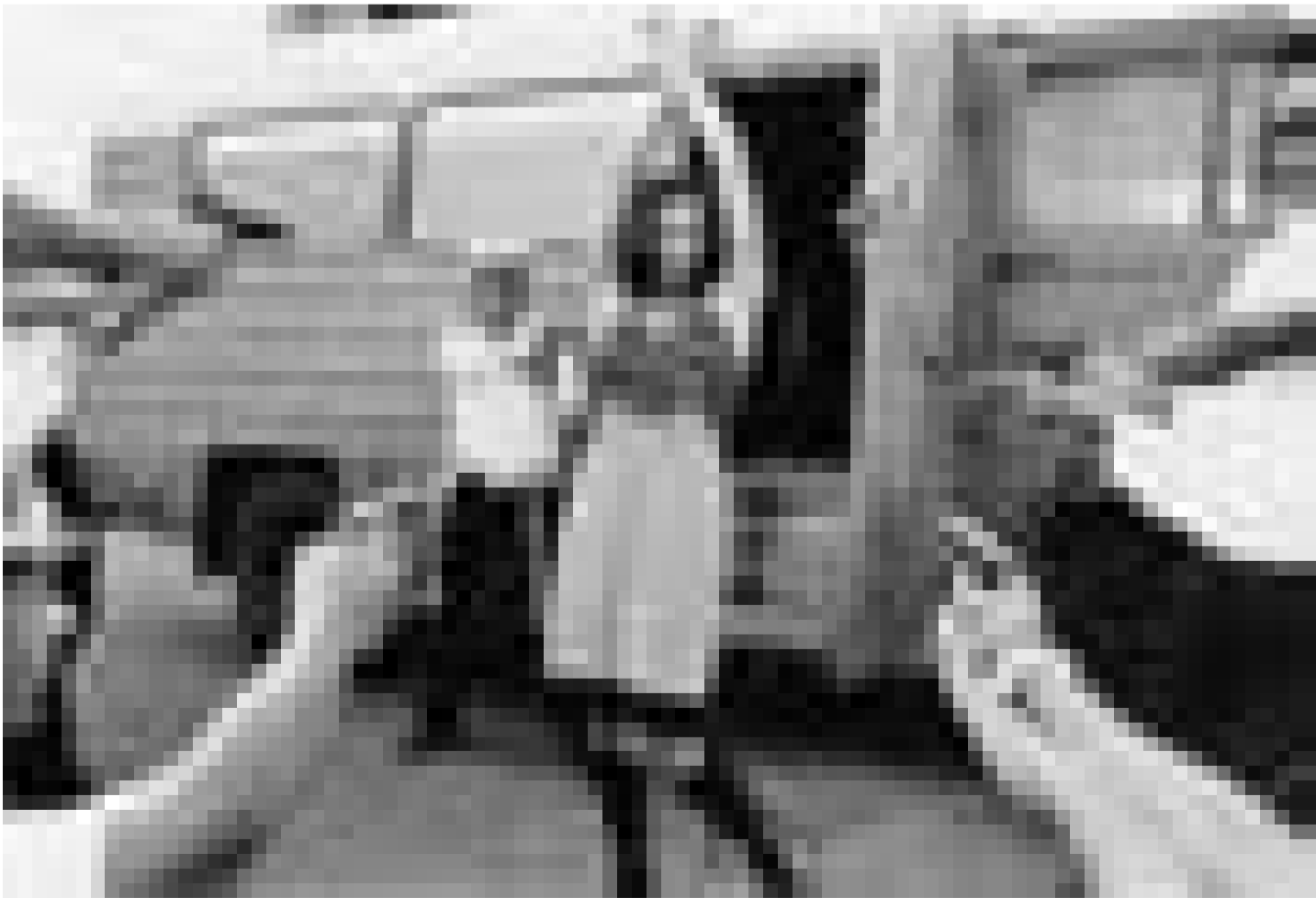
Tadelos rasiert und doch irgendwie schlampig. "Im Juli" zeigt ein Kontrastprogramm mit viel Poesie oder auch Kitsch.