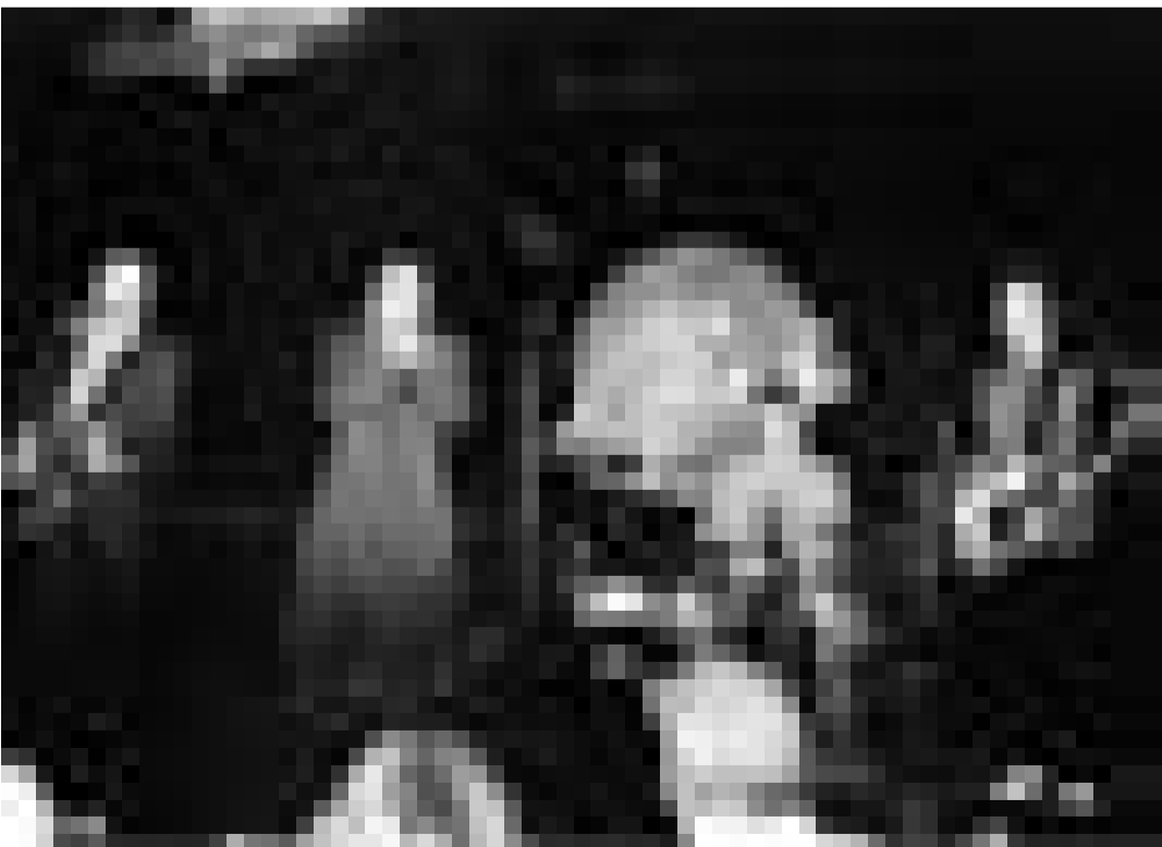
B. B. & the Blues Shacks. Am Freitag, den 5. Januar, 20.30 Uhr, Ducsaal, Freudenburg (D). Tel.: 0049 6582 2 57.

(s.) François BILTGEN, Ministre du Travail et de l'Emploi