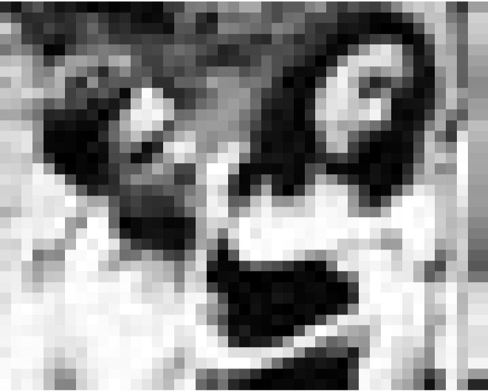
"Conte d'automne", d'Eric Rohmer, ARTE, lundi 22.1., 20h45.