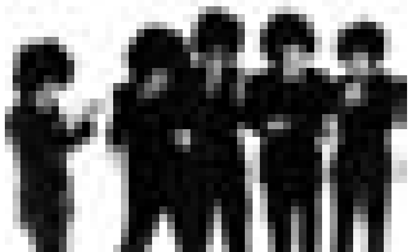
Wischmöpfe in Aktion: "Ghinzu", am Freitag, den 16. März in der Escher Kulturfabrik. Im Vorprogramm spielt die luxemburgische Formation "Logan".

Rock-Disko , Rock on "Stage", Stage, Trier, 20h. Tel.: 0049 651 5 61 10 20.