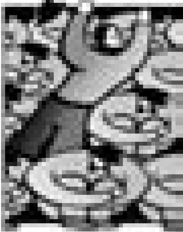
18e Festival des migrations, des cultures et de la citoyenneté. Du 16 au 18 mars au Hall Victor Hugo, Limpertsberg. Heures d'ouvertures: vendredi à partir de 14 heures, Samedi à partir de 10.30 heures et le dimanche à partir de 11 heures.