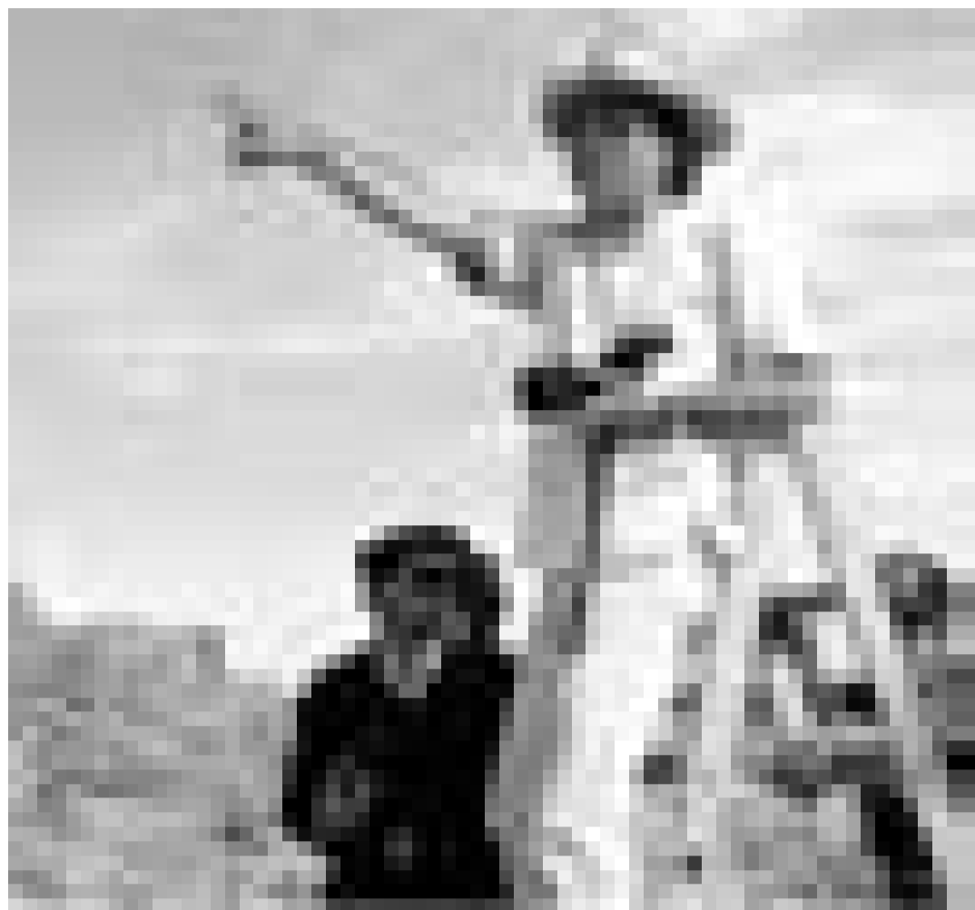
Terry Gilliam sur un tournage. Il sera à la Cinémathèque aujourd'hui vendredi 23 mars.

Der Seemann Gulliver strandet auf einer Insel, die von den Lilliputern bewohnt wird. Er verhindert einen Krieg zwischen König Lilliput und König Bombo und ermöglicht die Hochzeit der Königskinder. Zeichentrickfilm mit viel skurrilem Witz nach Jonathan Swifts Roman.