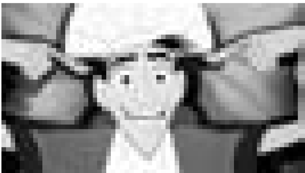
Für die, die immer ihren eigenen Kopf durchsetzen wollen: "The Emperor's New Groove" von Mark Dindal. Neu im Utopolis und im Ciné Cité (Luxbg), im Ariston (Esch) und im Kursaal (Rumelange).

Zeichentrickfilm über Pettersson, einen verrückten Erfinder, und seinen frechen Kater Findus. Nach den Büchern von Sven Nordqvist.