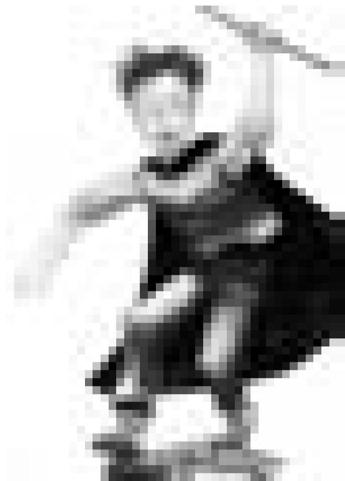
"Le phénomène Harry Potter", ARTE, dimanche 25.3. à 23h50.