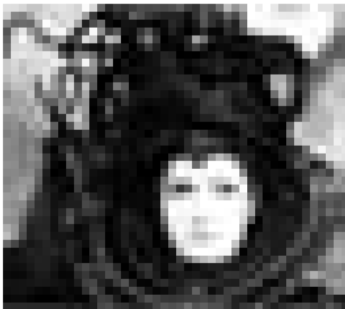
"Somnia: Le voyage en Hypnopompia", ARTE, mercredi 28.3. à 0h25.

Eternité et un Jour , Grèce 1998 de Theo Angelopoulos. Avec Bruno Ganz et Isabelle Renaud. 130'.