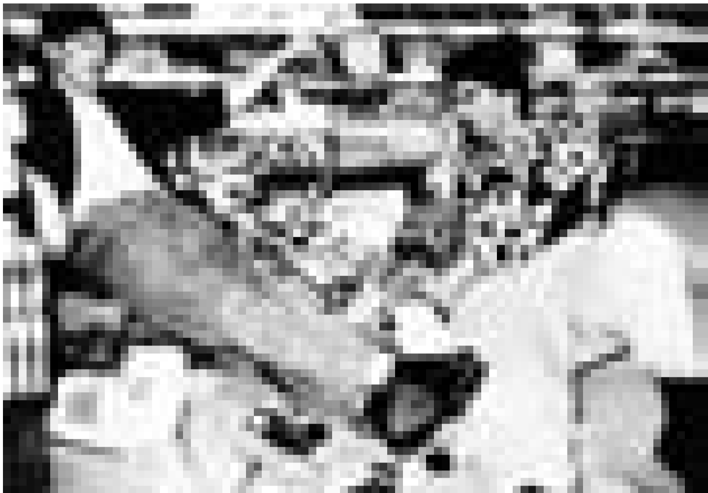
So macht Einkaufen wirklich Spaß! - 'Clerks' von Kevin Smith, Montag den 14.5. um 20h30 in der Cinémathèque.

prime de quatre mille dollars, de transporter sur cinq cents kilomètres de la nitroglycérine devant servir à éteindre l'incendie d'un puits de pétrole. L'un des plus célèbres films du cinéma français. Récit âpre et violent rigoureusement mis en scène par le plus noir