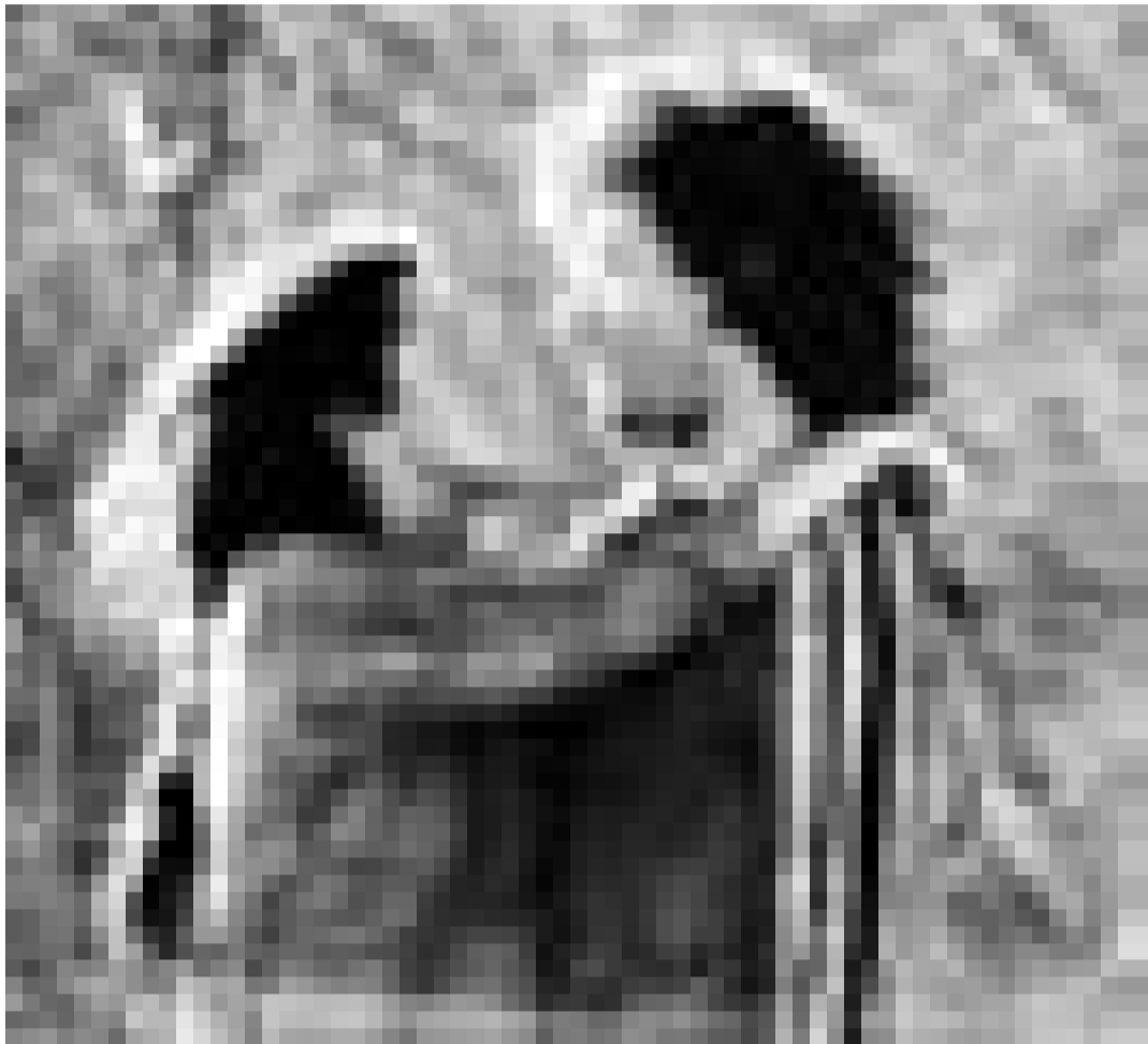
"Küss mich oder ich hack' dich" - 'Me, You, Them' von Andrucha Waddington. Neu im Utopia.