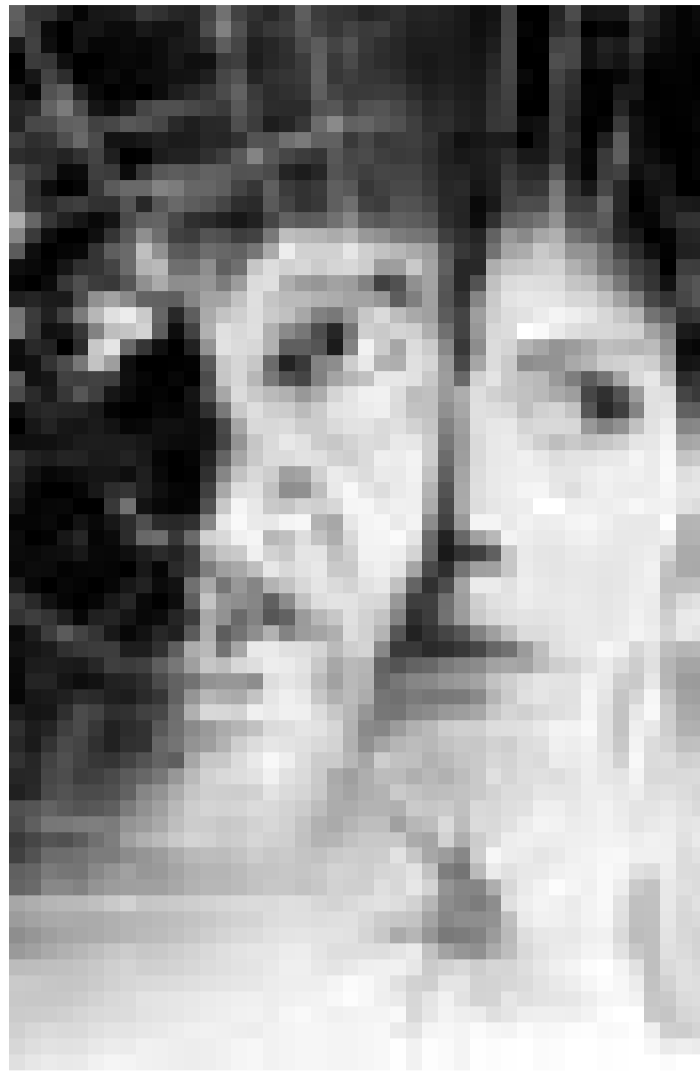
"Along came a spider" von Lee Tamahori. Neu im Utopolis.

Hegner u. Stefan Fjeldmark. D/DK/IRL 2000. 80'. Dt. Fass.; Zeichentrickfilm.