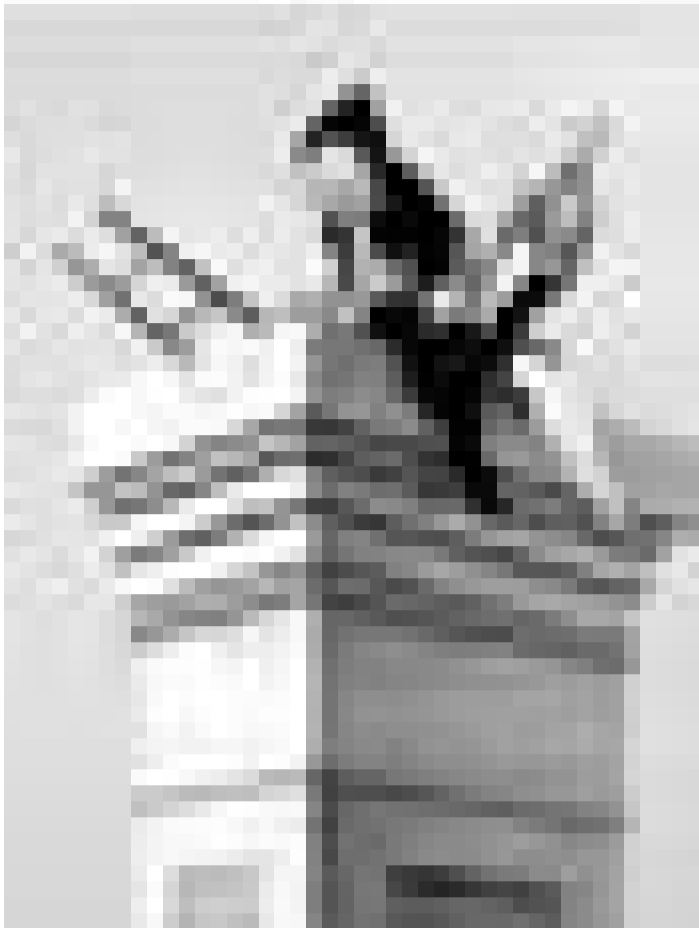
"Der König und der Vogel", Zeichentrickfilm von Paul Grimault. Sonntag, 24.6. um 15 Uhr in der Cinémathèque.

Das Andersen-Märchen von der schönen Schäferin, dem tyrannischen König und dem fröhlichen Schornsteinfeger. Zugleich ein naives Märchen und ein hintergründiges Lehrstück. Zu dem Zeichentrickfilm lieferte Jacques Prévert, der Vorreiter des französischen poetischen Realismus im Film der 30er Jahre, Drehbuch und Dialoge.