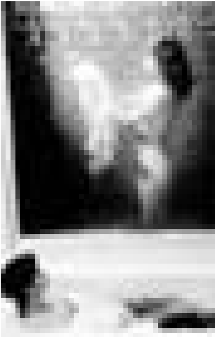
Double vitrage .... Cinédit présente "La Captive" de Chantal Akerman. Mercredi et jeudi 19h à l'Utopia.