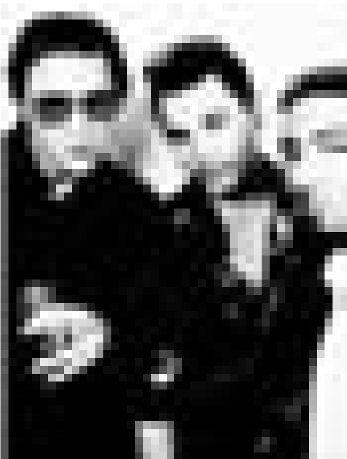
Enfin! Le 27 juin, les "Fun lovin' criminals" investiront la salle de l'Atelier à Luxembourg.