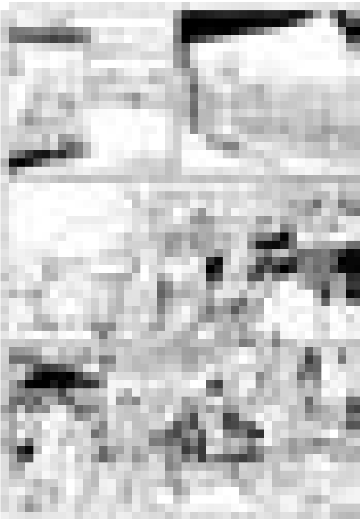
Ein Blick ins Atelier Hergé. Bis zum 9.9. im Museum Haus Ludwig in Saarlouis, Kaiser-Wilhelm-Str. 2.

exposition collective, Agence d'Art Contemporain Stéphane Ackermann (134, rue Adolphe Fischer, tél.: 48 38 87), jusqu'au 28.7., me., je. + ve. 14h - 18h et sur rendez-vous.