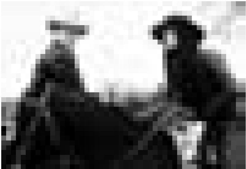
Kurzer Blick auf den sterbenden Westen. Matt Damon und Penelope Cruz mit Pferden.