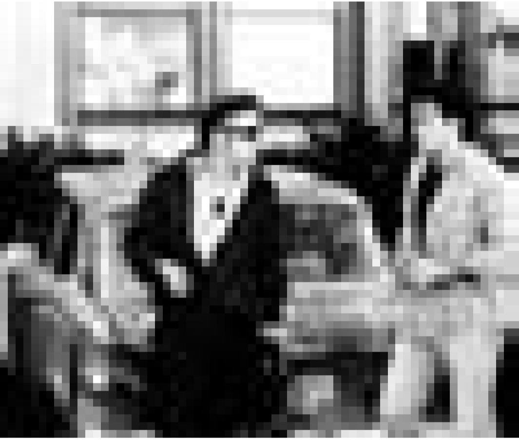
Auf, zu einem kühlen Drink in McCool's Bar. "One Night at McCool's" im Utopolis.