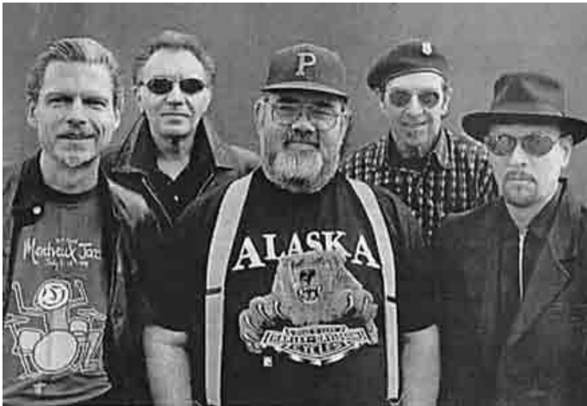
Des vétérans à Gouvy: Canned Heat.