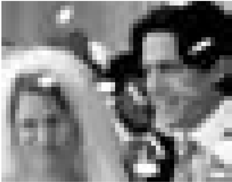
Se marier avec Hugh Grant: le rêve de chaque célibataire de plus de trente ans?