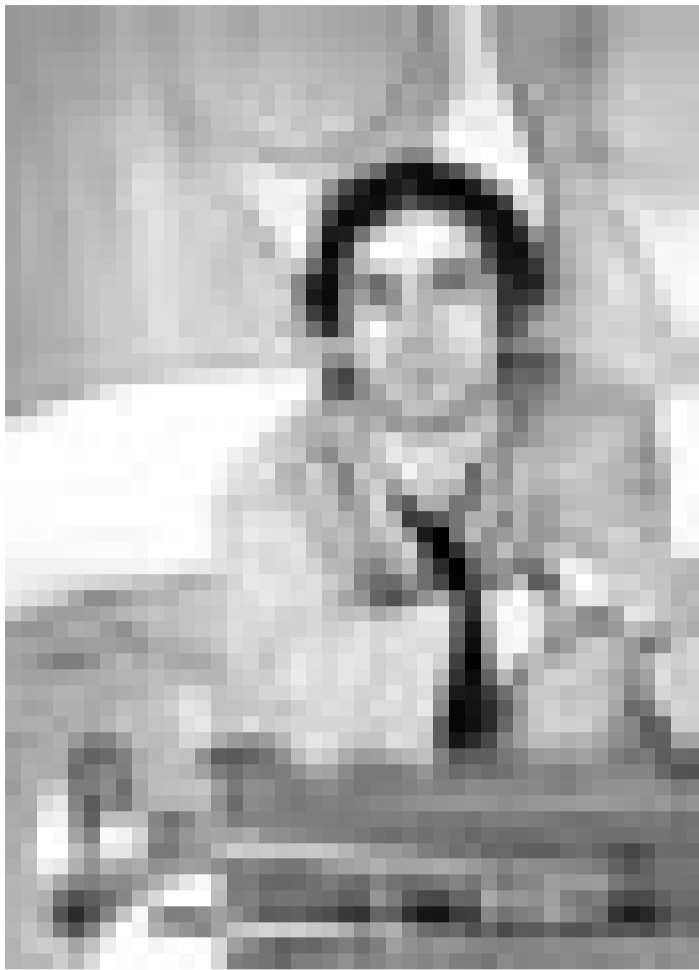
Le jazzclubluxembourg présente le mercredi 19 septembre le Paolo Fresu Quintet en concert au Melusina à Luxembourg.