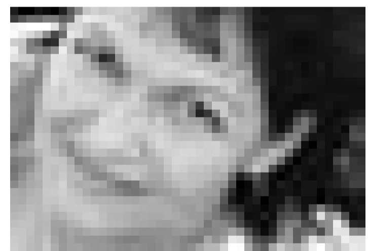
La Maison de la Culture à Arlon ouvre sa nouvelle saison avec la présentation du dernier album de Maurane. L'artiste donnera deux concerts: le samedi 15 et le dimanche 16 septembre.

Weltenzirkus - Eine Reise zu Menschen und Kontinenten , Auftaktveranstaltung zur Woche der Welthungerhilfe 2001, Abteikirche St. Maximin, Trier, 18h.