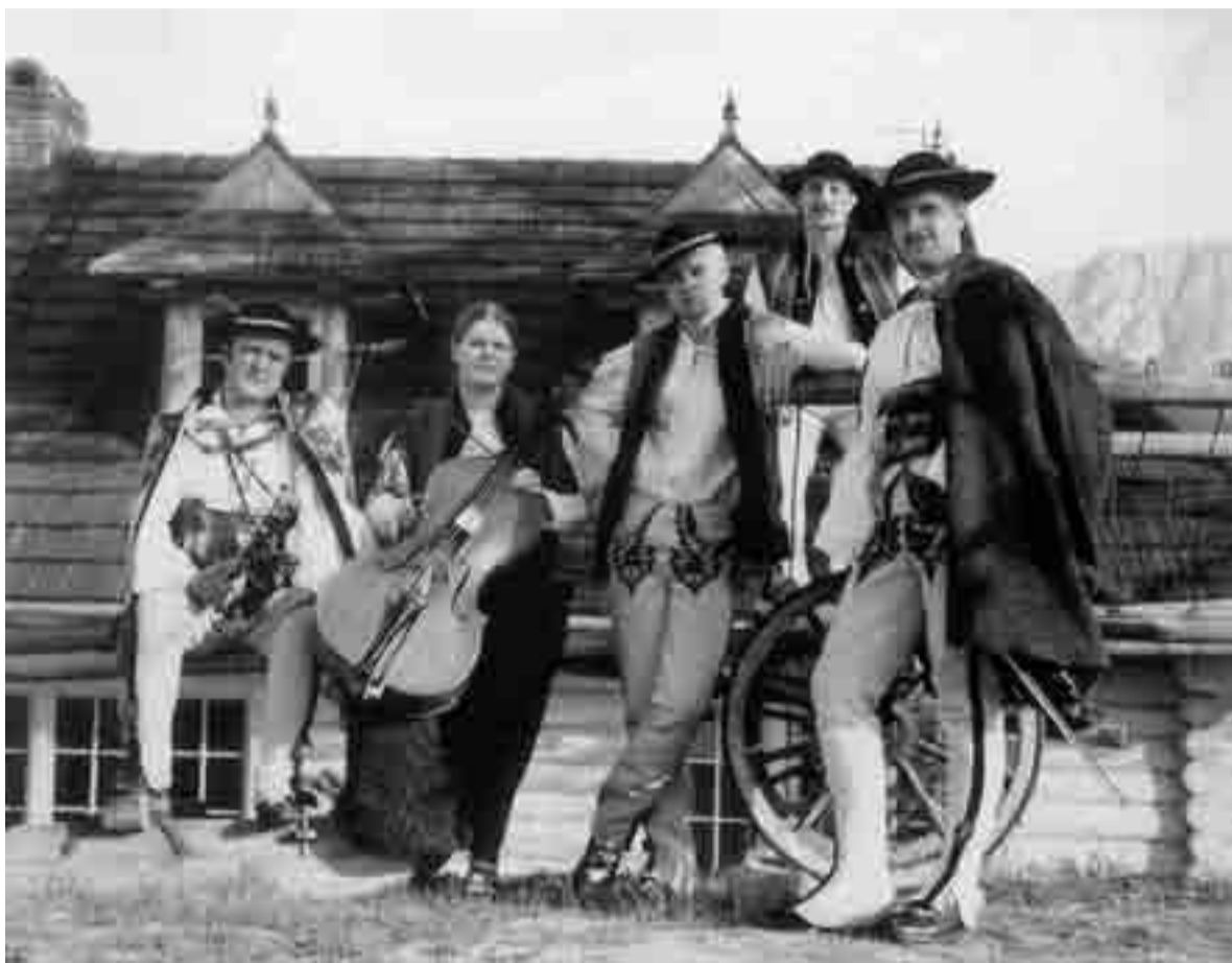
Trebuie-Tutki, folk polonais, le samedi 6 octobre à 20h au Sang & Klang à Luxembourg- Pfaffenthal.