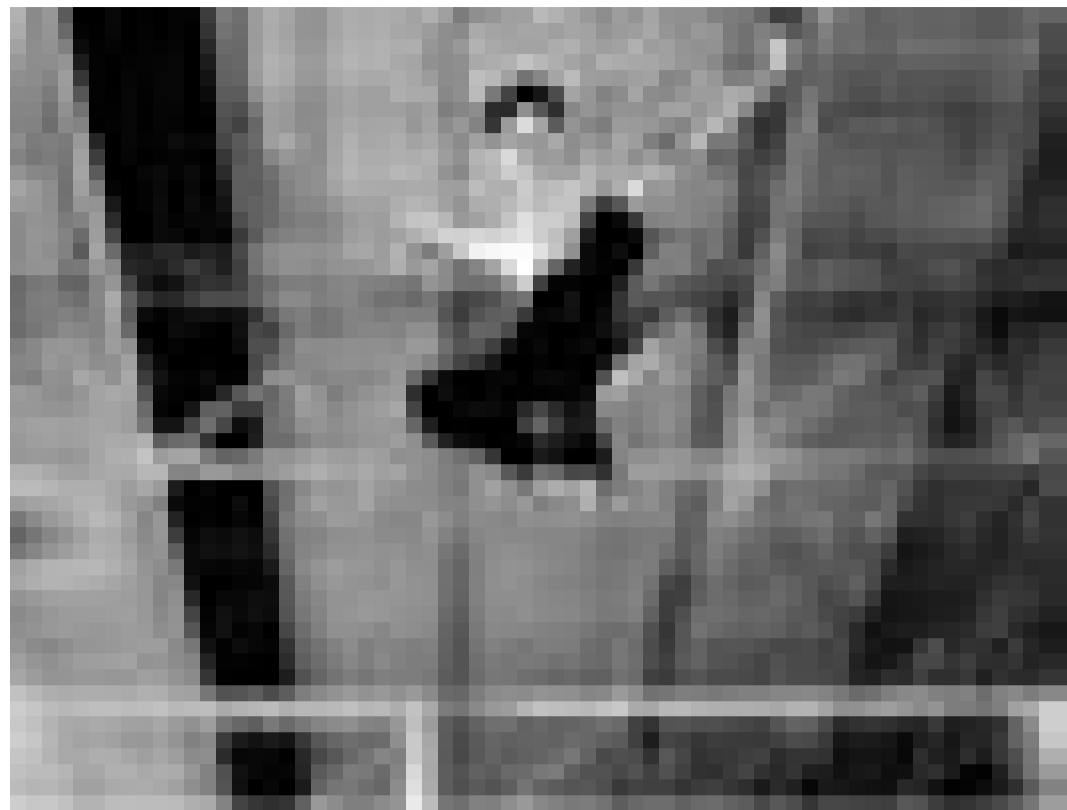
Un superman chinois: "The One" par James Wong. Nouveau à l'Utopolis.