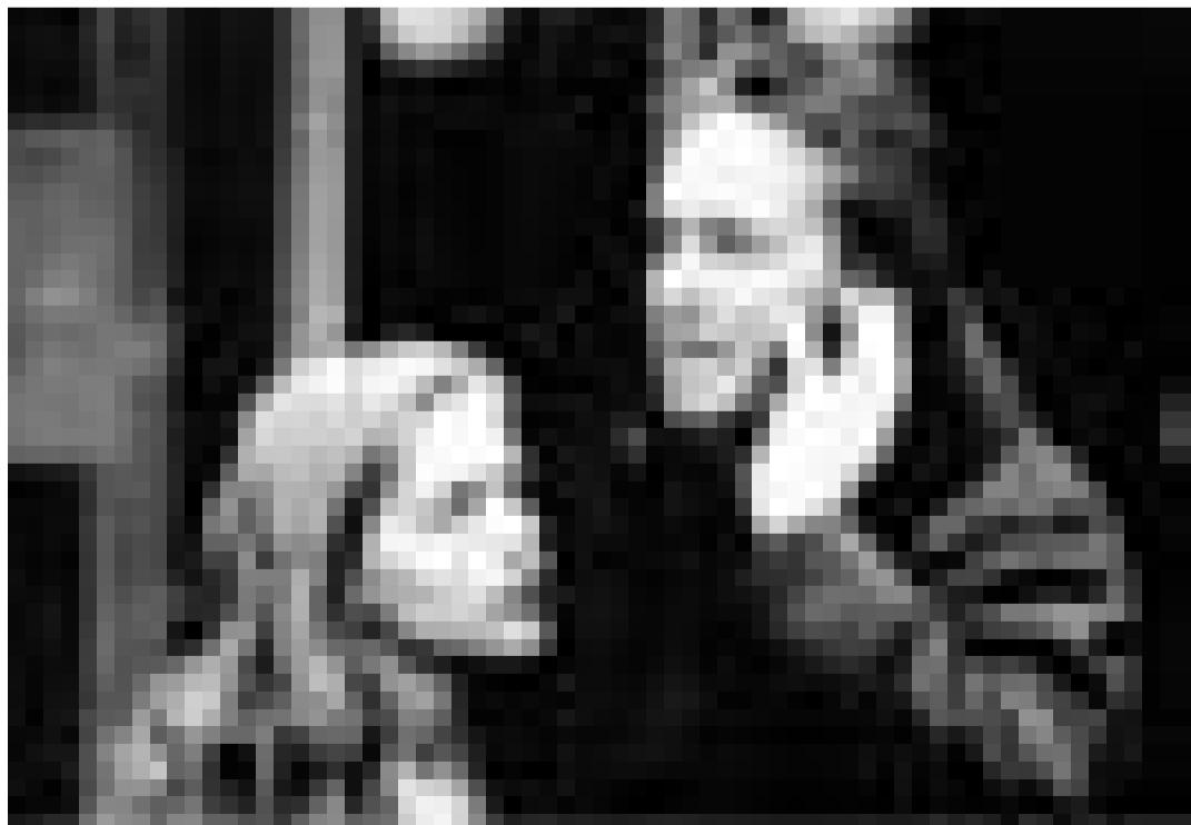
Un psycho-thriller: "Don't Say A Word" par Gary Fleder. Nouveau à l'Utopolis.

Un jeune homme dépressif, de bonne famille, choquant son entourage par un culte à la mort des plus macabre, retrouve une raison de vivre grâce à son amitié avec une femme de 80 ans qui vit en dehors de toutes conventions dictées par la société bourgeoise. Une comédie à 'anarchie douce', représentant l'époque 'flower power'.