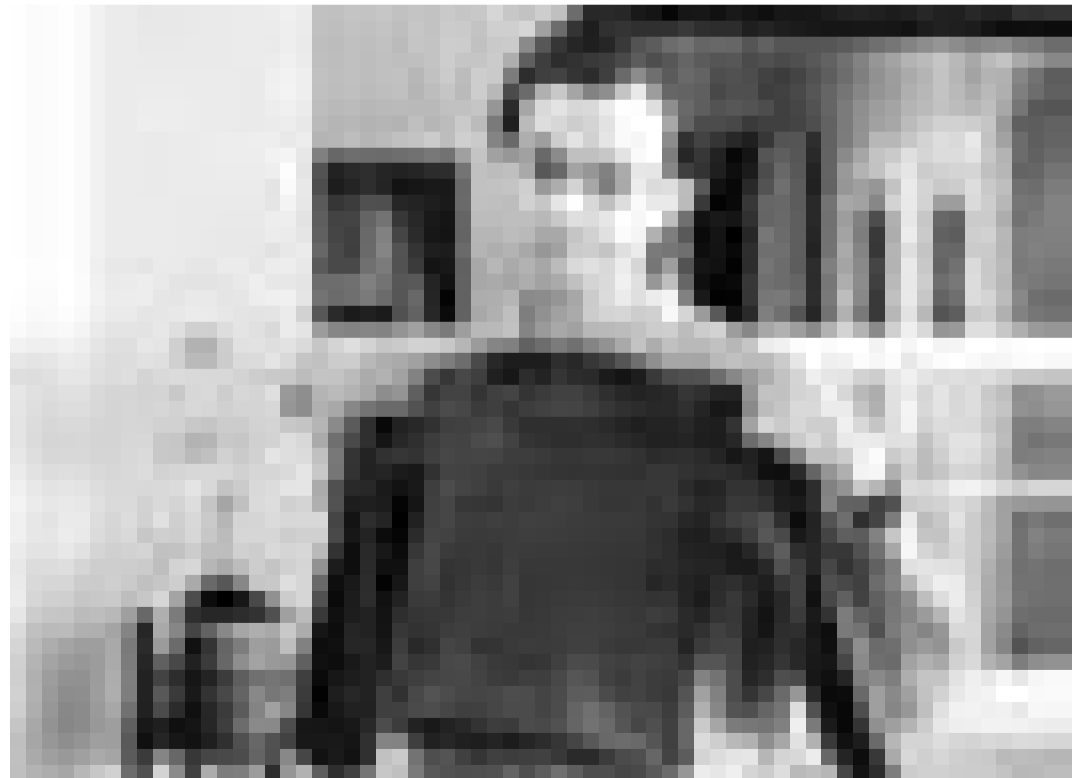
A son âge on ne se fait plus laver les pulls par sa mère ... "Tanguy" d'Etienne Chatiliez. A l'Utopia.

de Sean Penn. USA 2001. Avec Jack Nicholson, Benicio Del Toro et Robin Wright. V. o. s.-t. fr. + nl.; à partir de 14 ans.