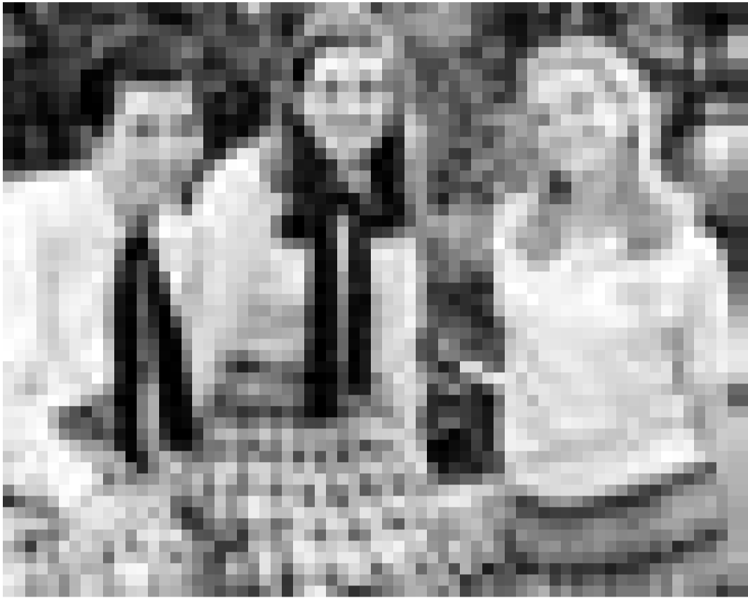
Laquelle est la vraie princesse? "Princess diaries" de Garry Marshall. Nouveau à l'Utopolis.