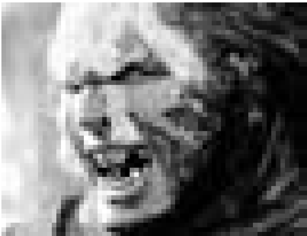
Quelle sale gueule ... "Lord of the Rings" de Peter Jackson, à l'Utopolis, Ciné Cité, Ariston et Kursaal.

de Chris Columbus. USA 2001. Avec Daniel Radcliffe, Emma Watson, John Cleese et Maggie Smith. 140'. Enfants admis.