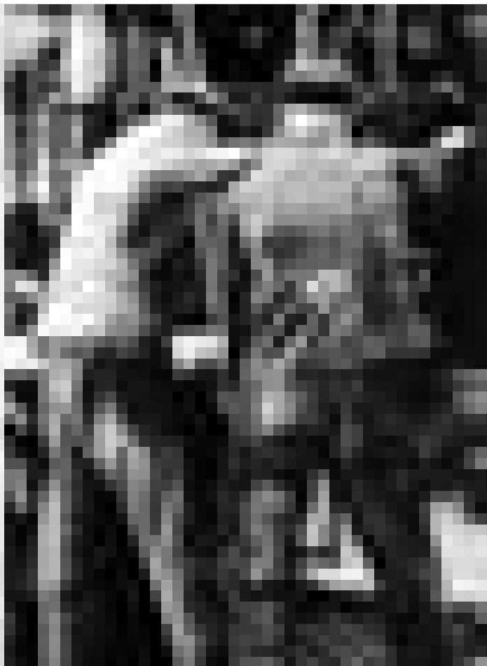
Thea Warncke - Vintage-Fotografien der 30er Jahre. Vernissage am 31.1. von 18h - 20h in der Galerie Clairefontaine, Luxembourg.

peintures, Alimentation Générale Art Contemporain Nosbaum &