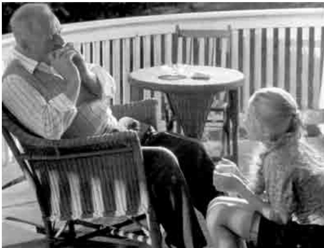
Une histoire d'un souvenir inventée par Stephen King, adaptée par William Goldman: "Hearts in Atlantis" de Scott Hicks. Au Ciné Cité.

de et avec Didier Bourdon, Bernard Campan et Pascal Légitimus. F 2001.