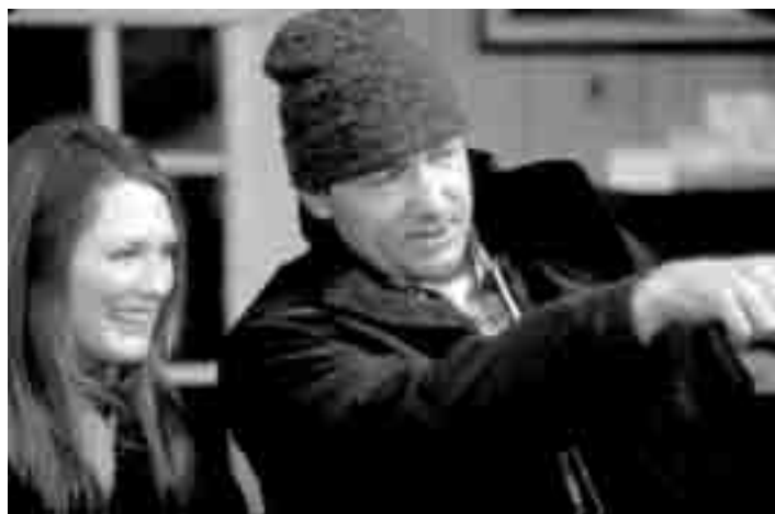
Une adaptation du roman d'Anne E. Proulx qui avait enchanté un vaste public: "The Shipping News" de Lasse Hallström. Nouveau au Ciné Cité.

de Steven Soderbergh. USA 2001. Avec George Clooney, Julia Roberts, Brad Pitt et Andy Garcia. 116'. V.o., s.-t. fr. + nl.; enfants admis.