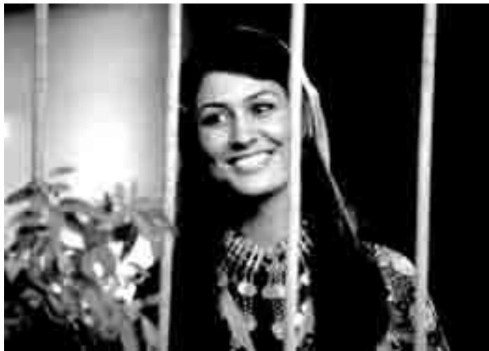
Cinédit présente une comédie médiatique réalisée en Turquie où elle a battu tous les records: "Vizontele" de et avec Yilmaz Erdogan. A l'Utopia.

détestent. Cette vie est celle qu'il connaîtra à la "Hogwarts School of Witchcraft and Wizardry".