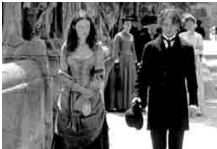
Jack l'Eventreur est de retour ... "From Hell" de Allen et Albert Hughes. Nouveau l'Utopolis.

Harry découvre qu'il y a une autre vie que celle auprès de tante Petunia et de l'oncle Vernon, qui le