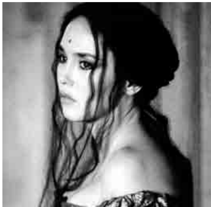
Isabelle Adjani dans "La Reine Margot" de Patrice Chéreau. Dimanche à la Cinémathèque.

Lun, 4.3., 21h00. USA 1976 d'Alan J. Pakula. Avec Robert Redford, Dustin Hoffman et Jason Robards. 130'.