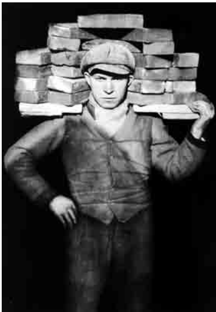
© August Sander: Handlanger , 1928.

A travers un choix d'environ 200 images issues du prestigieux fonds photographique de la SK Stiftung Kultur de Cologne, l'exposition "Spektrum" présente différentes tendances de la photographie, en particulier celle de l'Allemagne au cours du XXe siècle.