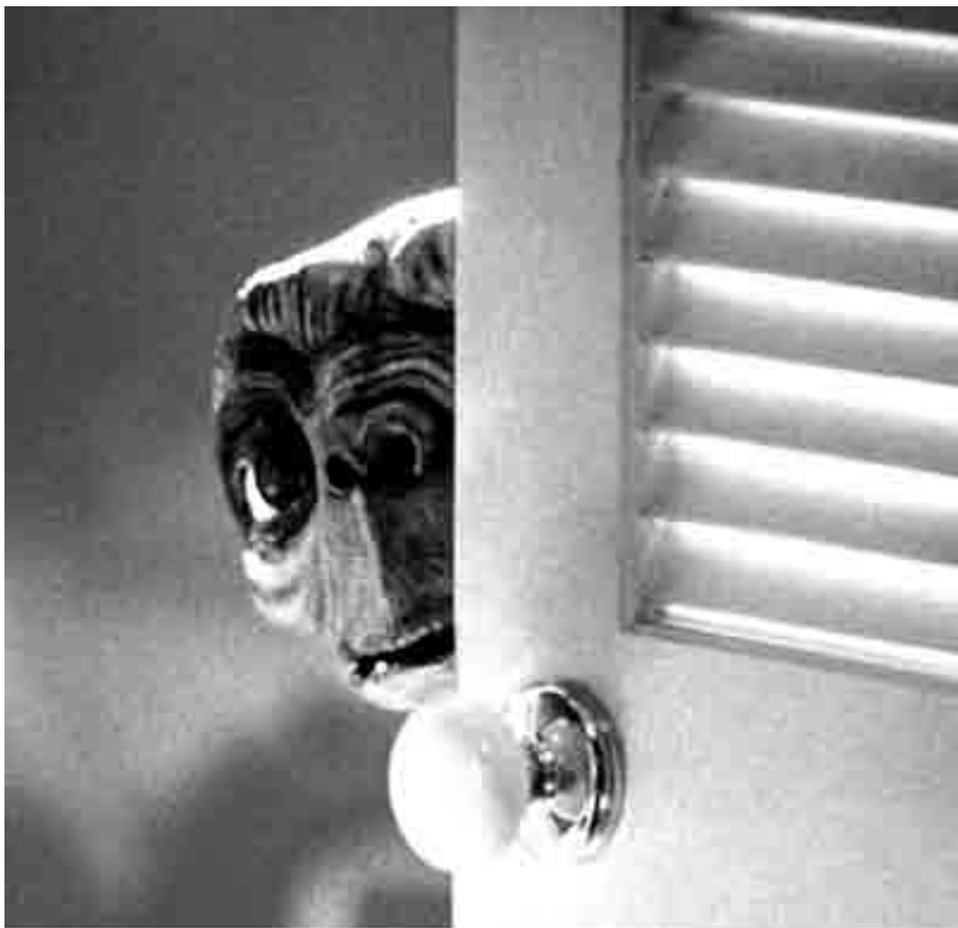
Après vingt ans il est de retour et n'a toujours pas de GSM... "E.T." de Steven Spielberg. Nouveau au Ciné Cité.