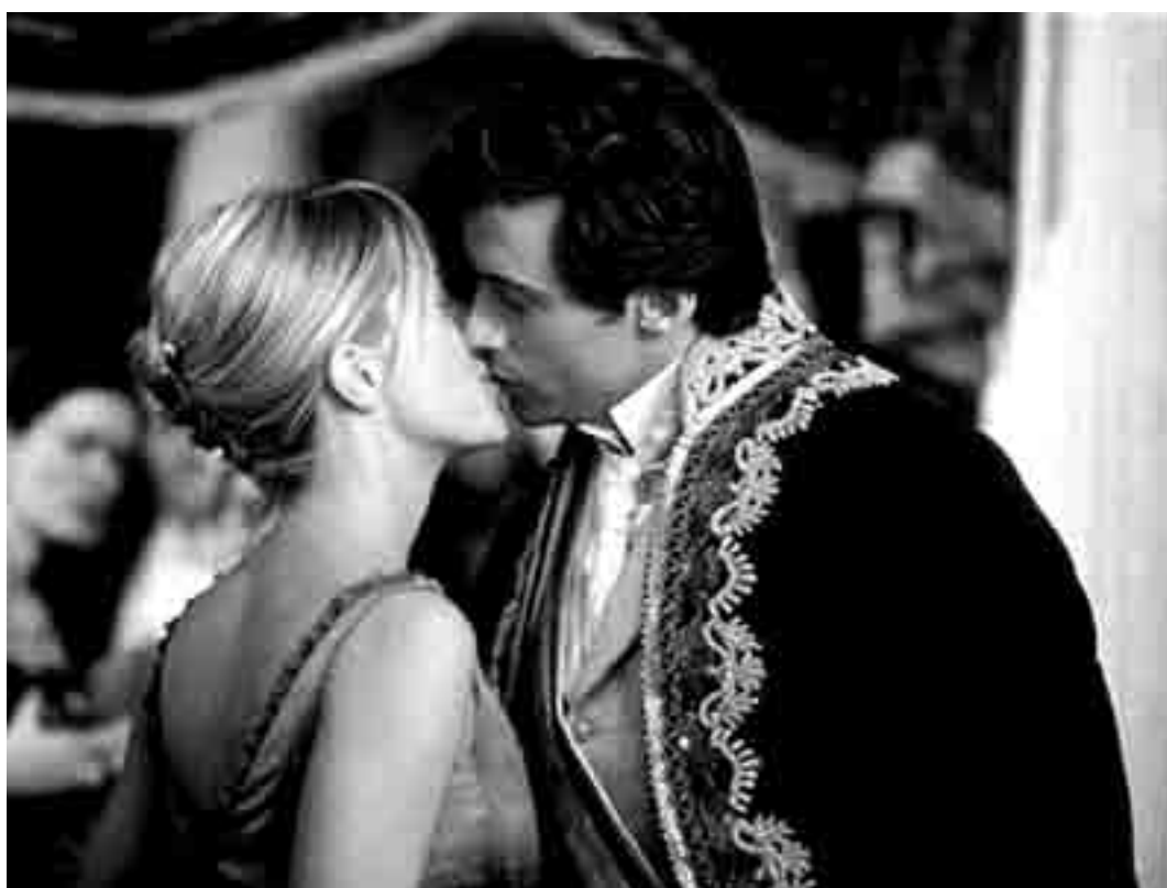
Une femme moderne émancipée se trouve un gentleman du 19e siècle. "Kate & Leopold" de James Mongold. Nouveau à l'Utopolis et à l'Ariston.

Un inventeur trouve le moyen de voyager dans le temps et va donc voir si le monde n'est pas devenu meilleur, 800.000 années dans le futur.