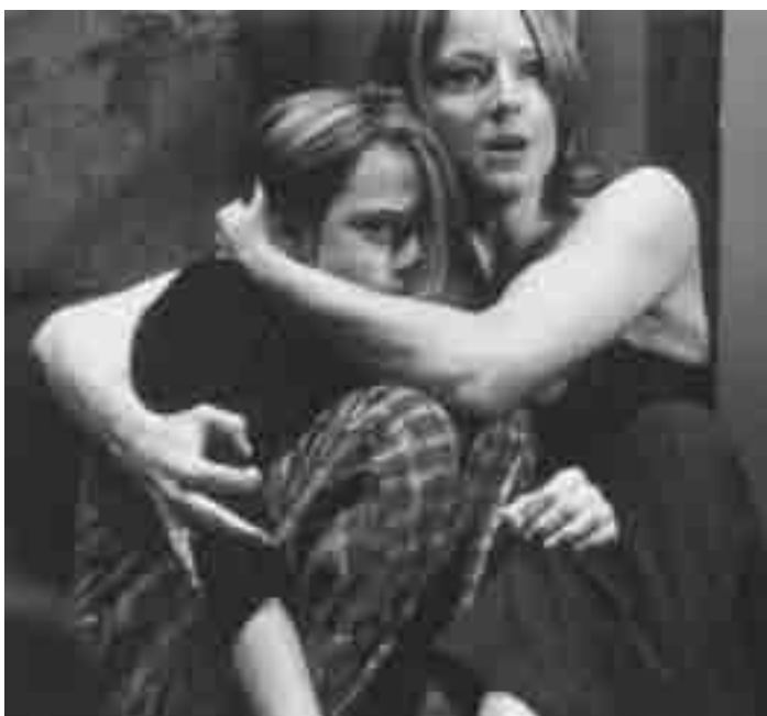
Don't panic in a ... "Panic Room" de David Fincher. Avant-première mardi à l'Utopolis.

XX Des éclats féministes, mais pas comme d'habitude. (lg)