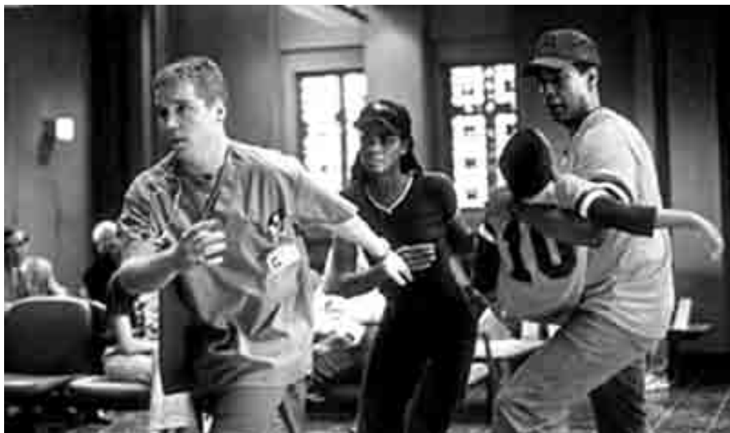
Urgence sans assurance maladie .... "John Q" de Nick Cassavetes. Nouveau au Ciné Cité.

Comme beaucoup d'autres, Mia Thermopolis est une jeune fille timide et discrète. Son existence paisible à San Francisco va pourtant se trouver bouleversée lorsqu'elle apprend qu'elle est en réalité une vraie princesse! Son destin serait de se préparer à régner sur la petite principauté européenne de Génovie.