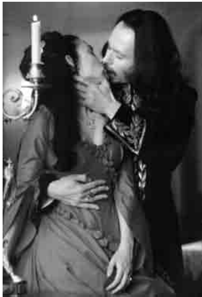
Le romantisme mordant ... "Bram Stoker's Dracula" de Francis Ford Coppola. Lundi à la Cinémathèque.