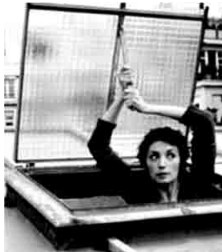
Histoires de gens secoués ... "Va savoir" de Jacques Rivette. Nouveau à l'Utopia.