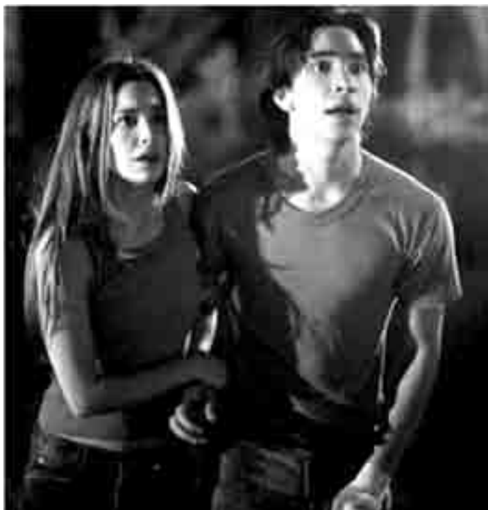
Ils n'en croient pas leurs yeux ... "Jeepers Creepers" de Victor Salva. Nouveau à l'Utopolis.

Un inventeur trouve le moyen de voyager dans le temps et va donc voir si le monde n'est pas devenu meilleur, 800.000 années dans le futur.