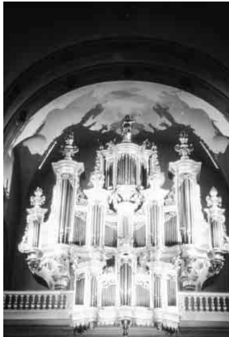
Des orgues historiques en sept étapes: voilà le programme ambitieux de "La route des orgues de Moselle".

Depuis 1991, le programme de restauration des orgues en Moselle est accompagné par un festival: "La route des orgues de Moselle", qui débute ce vendredi, 3 mai.