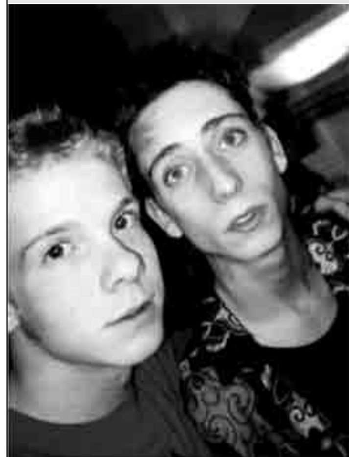
"Crampack", un American Pie à l'espagnole.