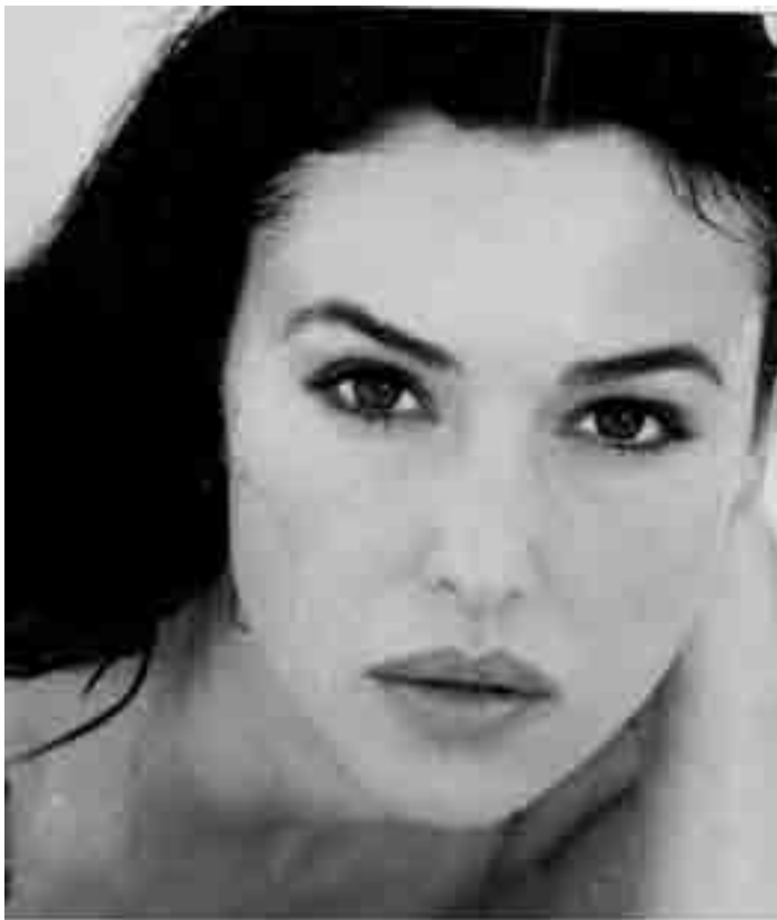
Monica Bellucci dans "Irréversible" de Gaspar Noé. Un film controversé sur un viol qui invite au voyeurisme. Nouveau à l'Utopia.