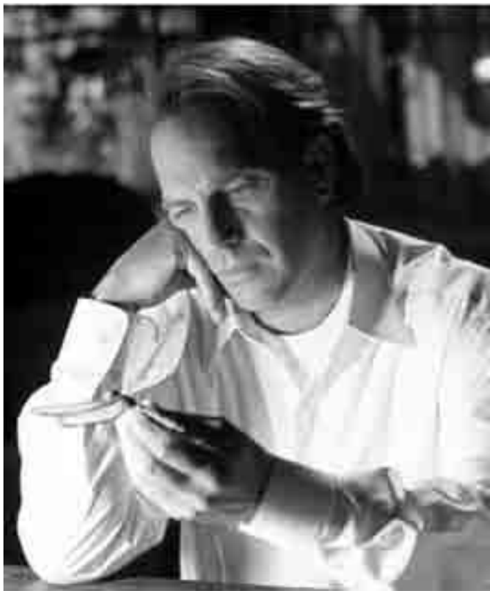
L'épouse de Joe Darrow (Kevin Costner) a disparu tragiquement. Il se réfugie dans un monde surnaturel ... "Dragonfly" de Tom Shadyac. Nouveau à l'Utopolis.

XX Trop d'action usée fait que la rencontre Murphy-DeNiro, qui devait pourtant être l'intérêt principal du film, tombe complètement à plat. (gk)