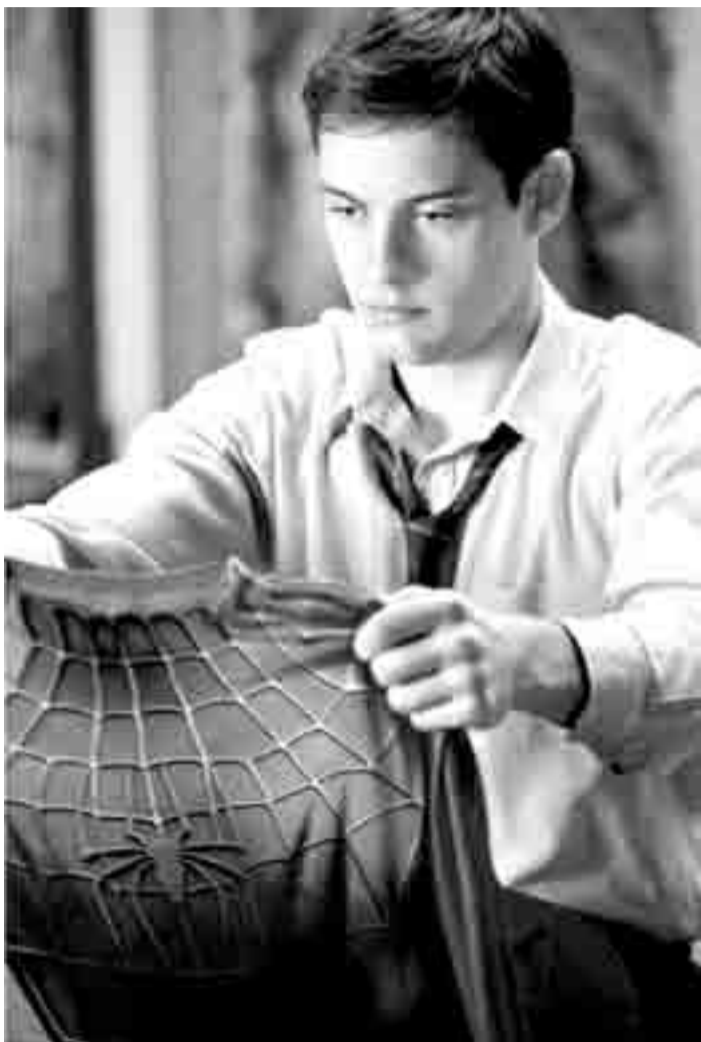
Peter Parker (Tobey Maguire) ferait mieux de rester svelte, car en cas d'urgence il doit vite enfiler son costume étroit de "Spiderman". Nouveau à l'Utopolis (Luxembourg) et à l'Ariston (Esch/Alzette).