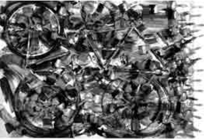
Arman - Les Cycles de vie, du 21 juin au 8 septembre à la galerie d'Art de la Ville de Luxembourg. Vernissage le 20 juin à 18h.