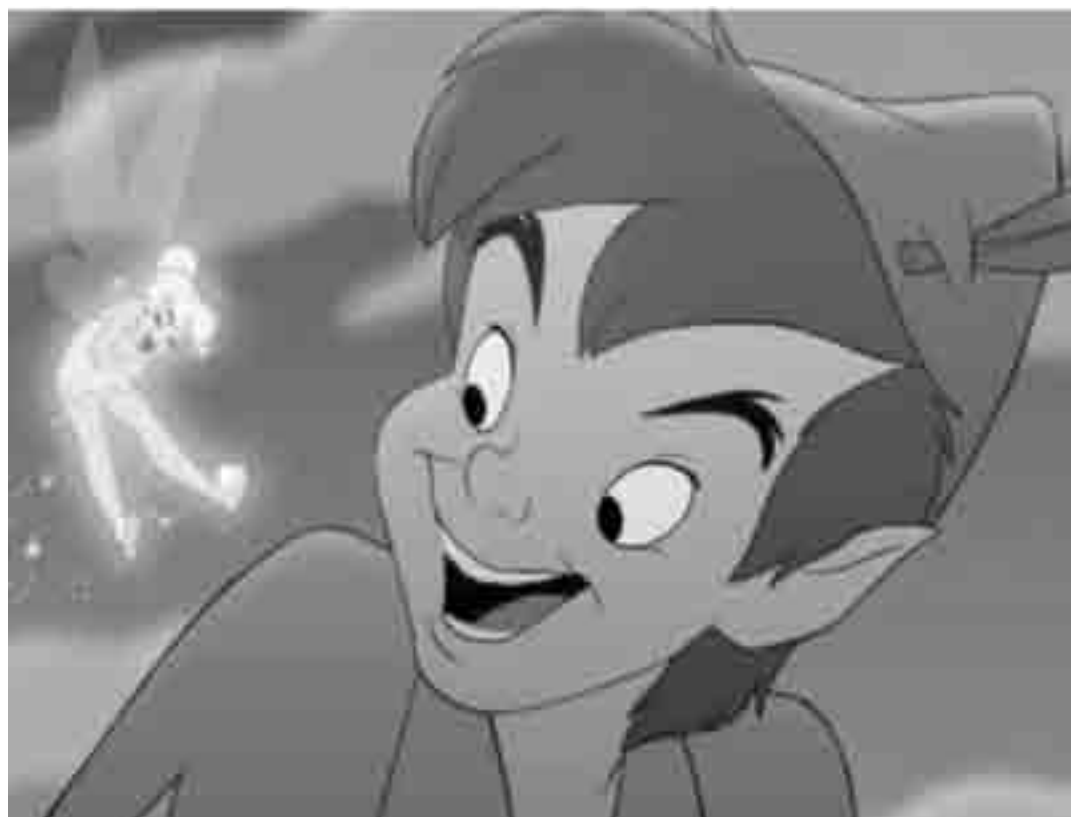
Cinquante ans après la première du dessin animé Peter Pan: "Peter Pan 2: Retour au Pays Imaginaire" de Robin Budd. Nouveau à l'Utopolis et au Ciné Cité (Luxembourg), et à l'Ariston (Esch/Alzette).

Un groupe de milliardaires cherche des paris à faire. Ils organisent une course de Vegas à Silver City.