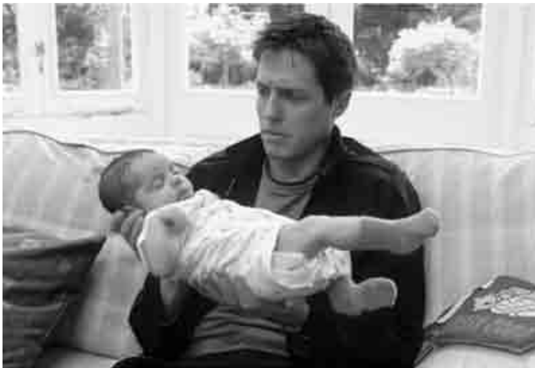
Hugh Grant joue un célibataire pour qui mariage et enfants ne sont pas du tout une option: "About a Boy" de Paul et Chris Weitz. Nouveau à l'Ariston (Esch/Alzette).

USA 2002 de John Woo. Avec Nicolas Cage, Christian Slater et Adam Beach. 135'. V.o., s.-t. fr. + nl.; à partir de 14 ans.