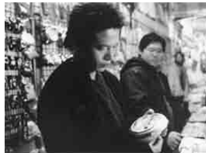
Il règle le temps à l'heure parisienne: "What Time is it There" de Tsai Ming-Liang. Nouveau à l'Utopia.

Val Waxman, un réalisateur qui a connu son heure de gloire dans les années quatre-vingts, met aujourd'hui en scène de simples spots publicitaires. A Hollywood,