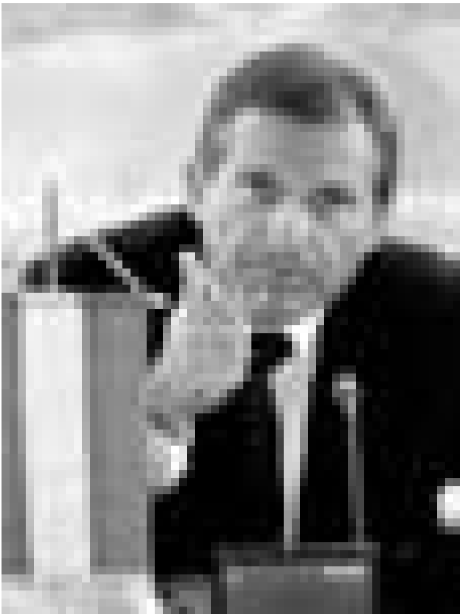
Minister gegen zu viel Mensch- lichkeit: Ernst Strasser (ÖVP).

Der österreichische Innenminister hat mit einer neuen Verordnung hunderte Flüchtlinge in die Obdachlosigkeit getrieben. Die Konservativen wollen so WählerInnen der FPÖ gewinnen.