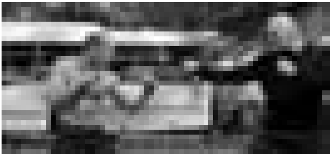
Chauffeurs de bus pendant leur pause ... "The Transporter" de Corey Yuen. Nouveau au Ciné Cité.