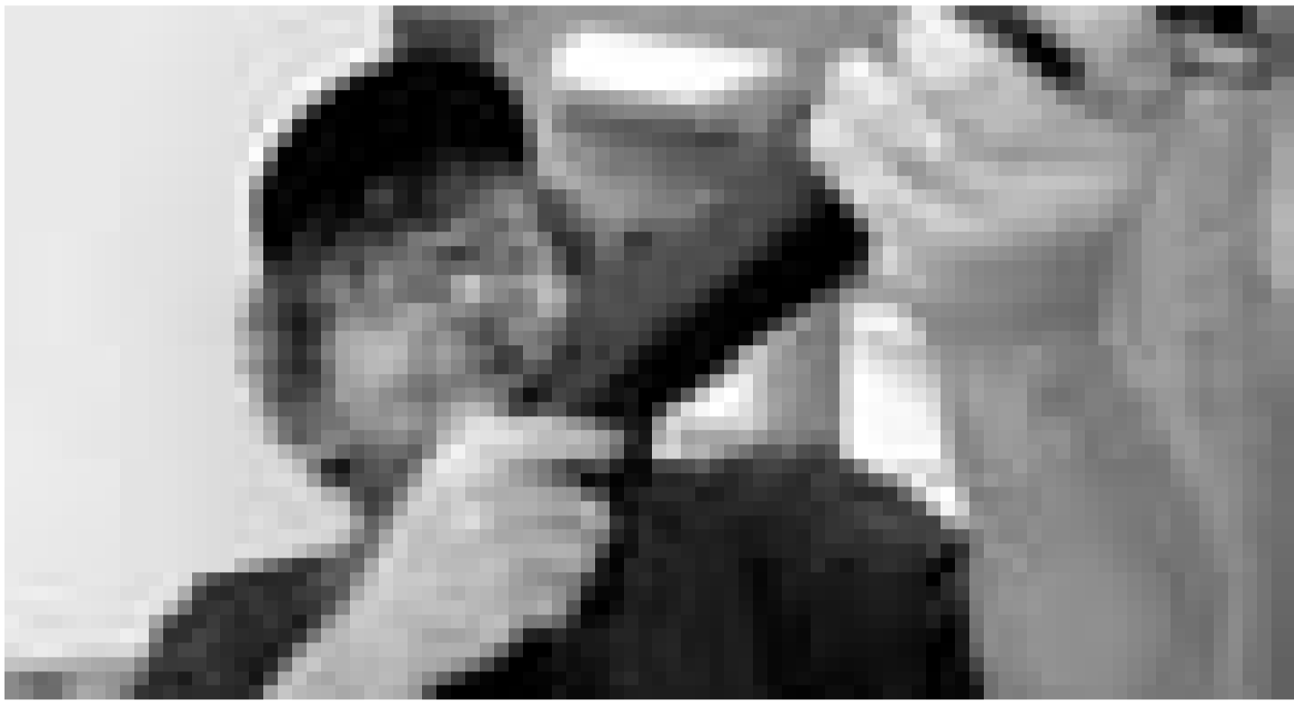
Une analyse plutôt satirique de Michael Moore sur le droit d'avoir des armes aux Etats-Unis. "Bowling for Columbine", mardi prochain avant-première à l'Utopia.