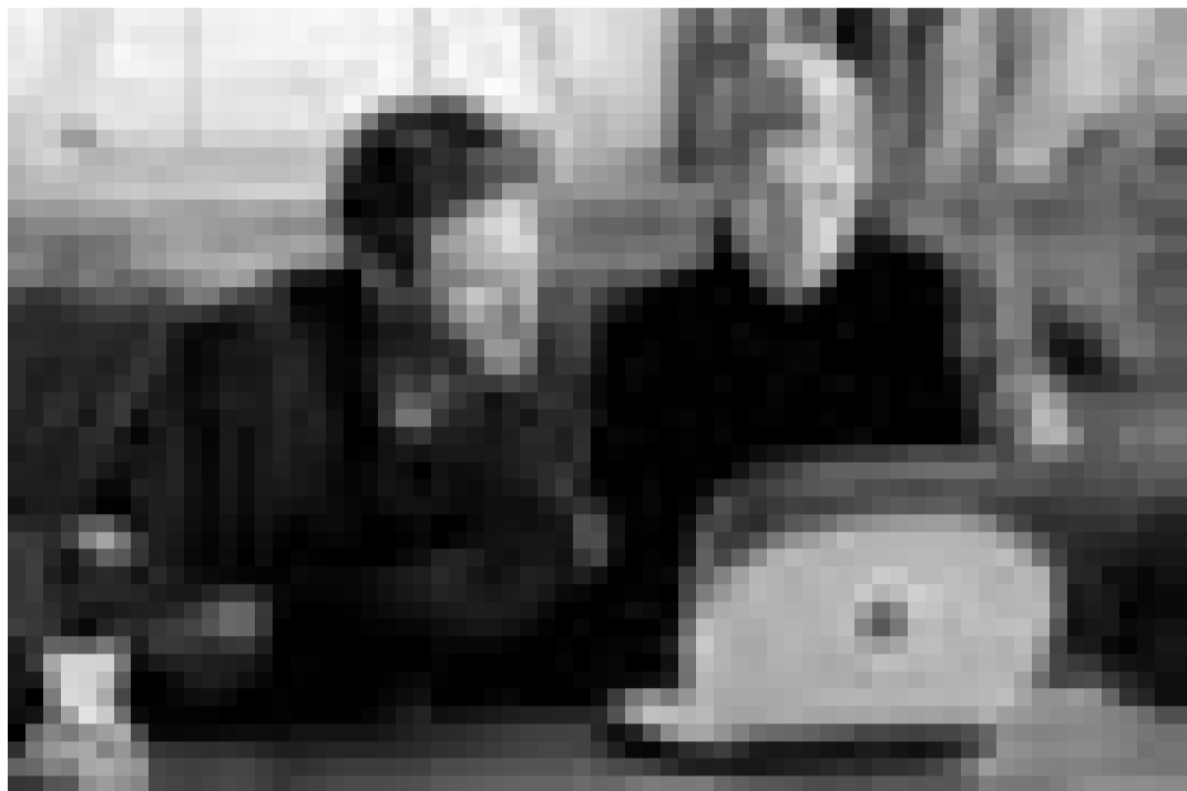
Une histoire romantique pour universitaires, sponsorisée par Apple ... Aaron Eckhart et Gwyneth Paltrow dans "Possession" de Neil LaBute. Nouveau à l'Utopia.