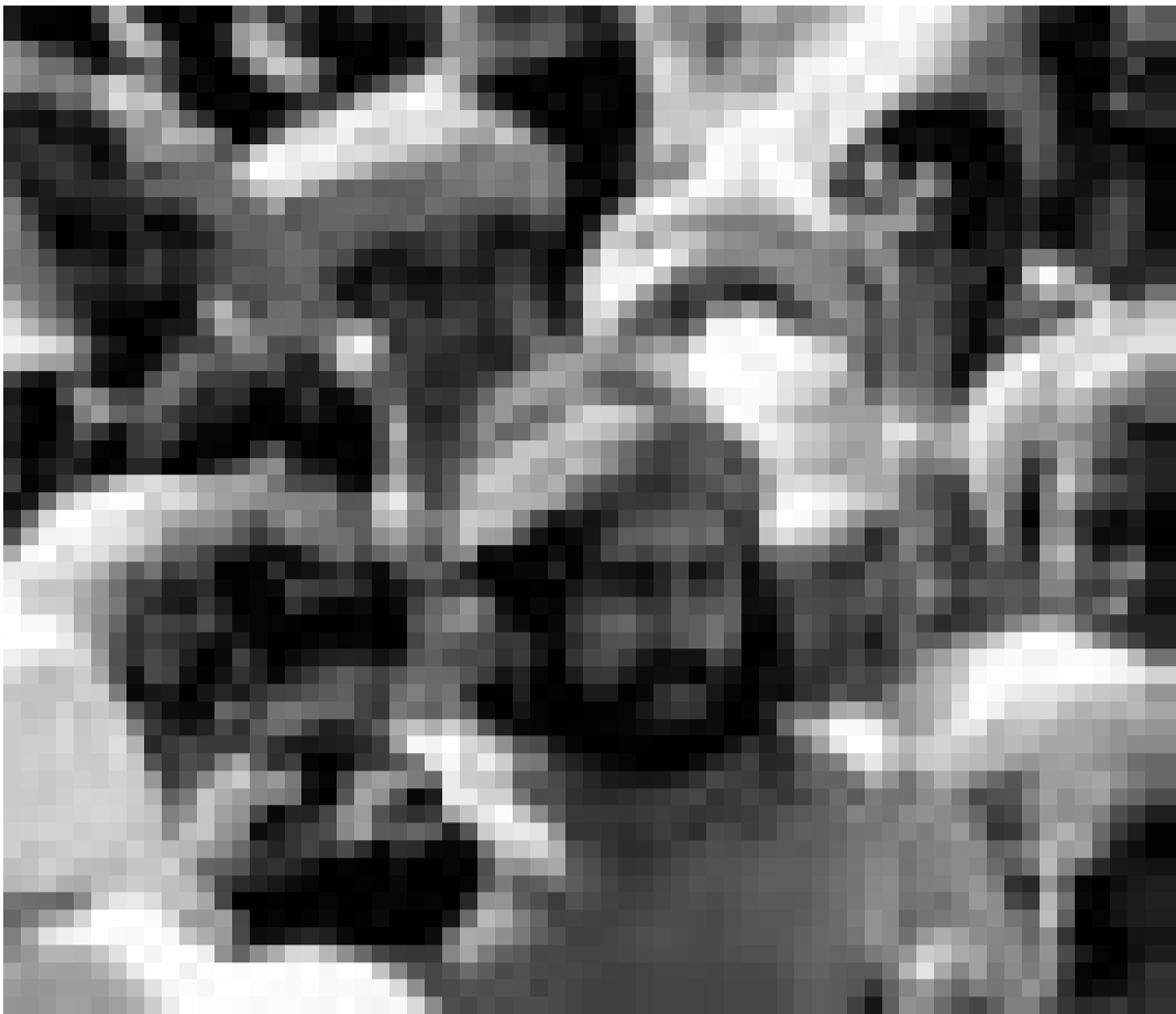
Une histoire d'honneur ... Heath Ledger dans "Four Feathers" de Shekhar Kapur. Nouveau à l'Utopolis.