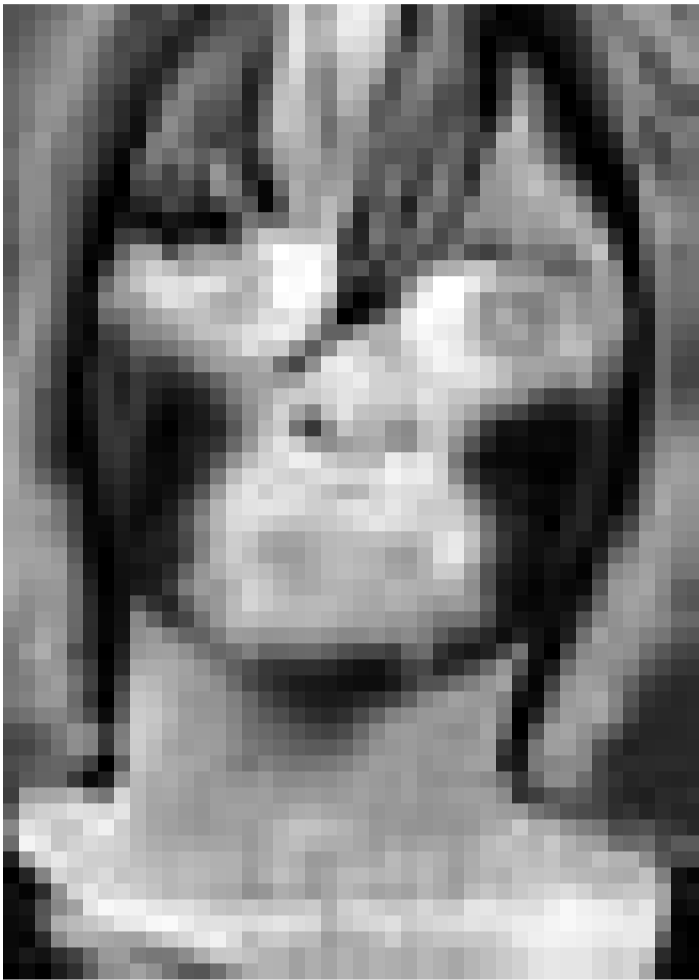
Die thermische Aura - Wärmebildfotografie und Schwarzweißaufnahmen. Vom 17. Januar bis zum 22. Februar im Espace 2 der Galerie Clairefontaine, Luxembourg.