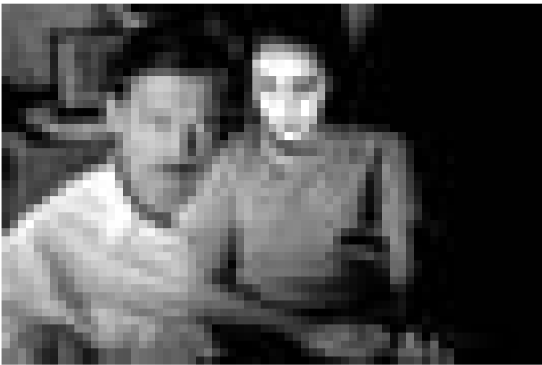
Javier Bardem dans "The Dancer Upstairs", un film politique de l'apprenti réalisateur John Malkovich d'après un roman de Nicholas Shakespeare. Nouveau au Ciné Cité.