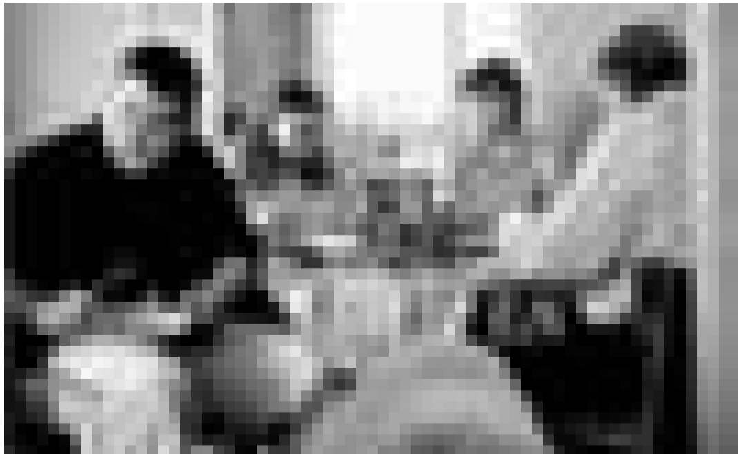
Familie Bassett ödet sich an .... James Gordon, Alison Garland, Lesley Manville und Timothy Spall in "All or Nothing" von Mike Leigh. Neu im Utopia.