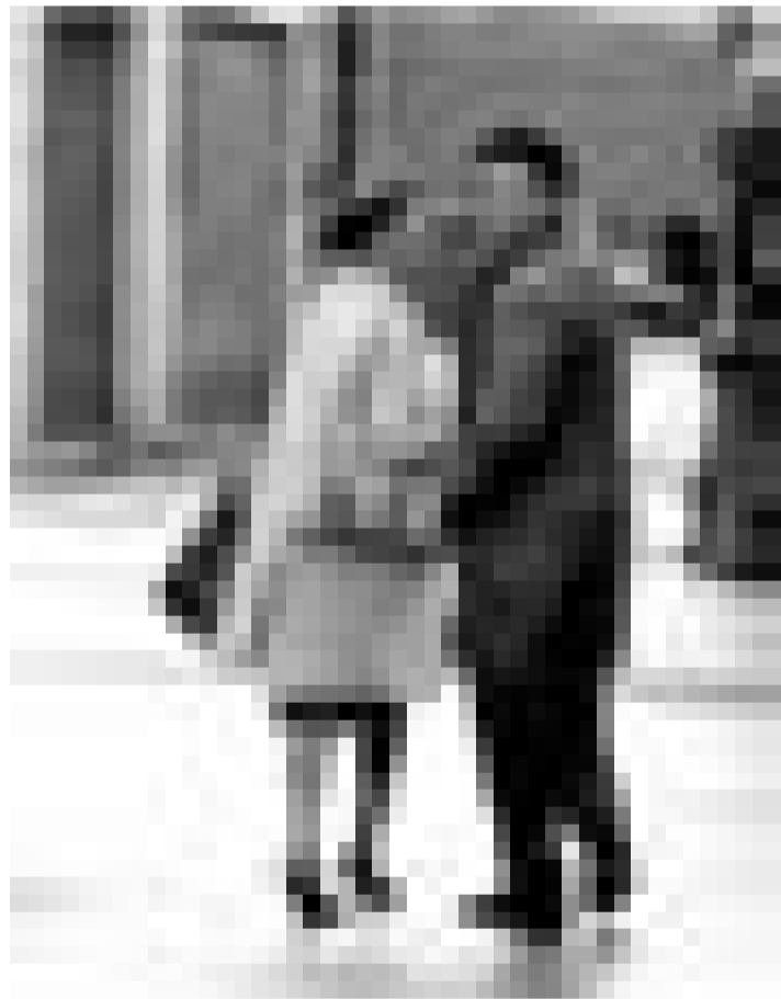
Ein Remake des berühmten Thrillers "Charade" von 1963 ... Thandie Newton und Mark Wahlberg in "Truth about Charlie" von Jonathan Demme. Neu im Utopolis.

Entre la Corée, Hong Kong, Cuba, Londres et l'Islande, James Bond