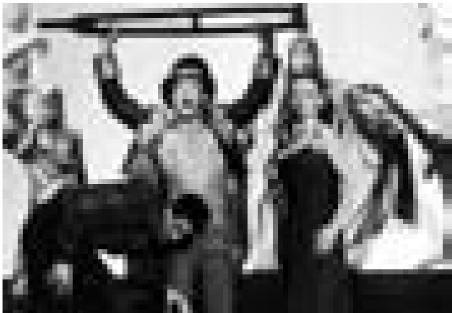
"An Evening with Music from Andrew Lloyd Webber". Am 1. März in der Differdinger Sporthalle.

Holden - I don't wanna Grow Up! Frühlingserwachen eines Outsiders, mit der Jugendtheatergruppe Namasté,