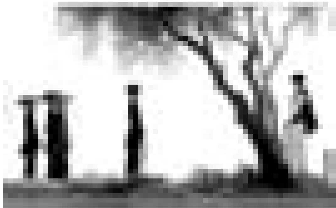
Chasse à l'or des Romanov ... "Corto Maltese, la cour secrète des arcanes", dessin animé de Pascal Morelli suivant Hugo Pratt. Nouveau à l'Utopolis.