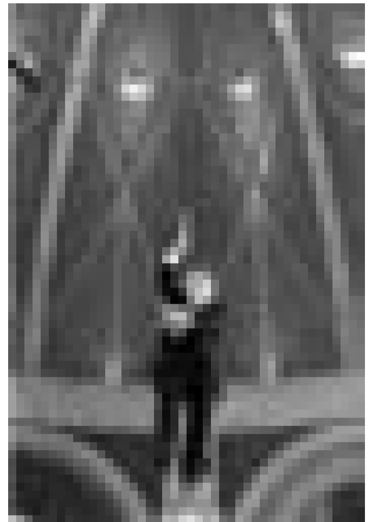
Gute Aussicht aber unbequem ... Owen Wilson in "I Spy" von Betty Thomas ... Neu im Utopolis.