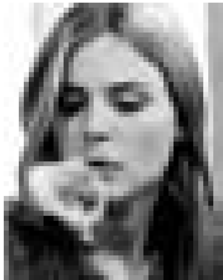
Isabelle Carré, gagnante du César meilleure actrice dans "Se souvenir des belles choses" de Zabou Breitman. Reprise à l'Utopia.

Herr Props Haus ist eine Bruchbude, seine Nachbarin eine Hexe und eigentlich hat sich die ganze Stadt gegen ihn verschworen. Nur die sprechende Kuh Berta ist stets auf seiner Seite.