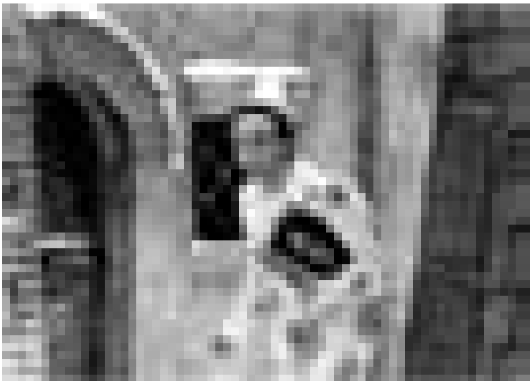
La Fondation Kannerschlass organise une soirée de gala avec présentation du film "Pinocchio" de et avec Roberto Benigni. Mardi à 19h30 à l'Utopia.