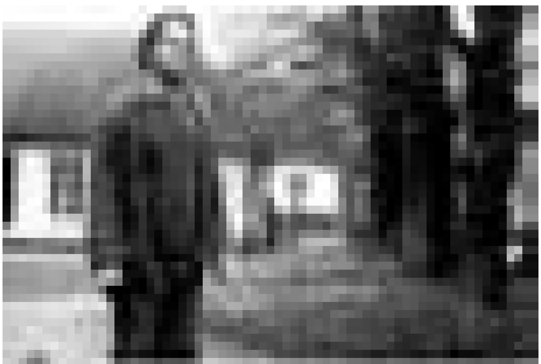
Pas compris ...? "The Château" de Jesse Peretz. Au Kinosch (Esch/Alzette).

Un orphelin de 14 ans trouve une paire de baskets magiques ... et devient le nouveau champion de la NBA.