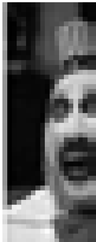
House of 1000 Corpses