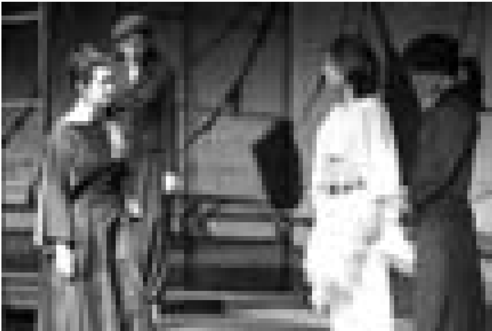
"Andromaque" de Racine, sera encore représenté ce vendredi 4 avril et les 5 et 12 mai au "Théâtre des Capucins".