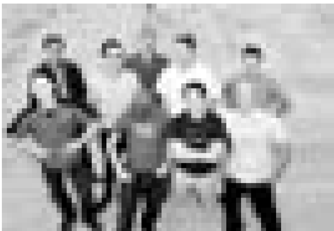
Ob diese Männer wohl nötig haben, wonach sie sich benannt haben? "Frau Doktor". Die deutsche Ska-Band spielt am Donnerstag, den 17. April im Club Hellmut in Saarbrücken.

Les sept dernières paroles de notre Sauveur sur la Croix , de