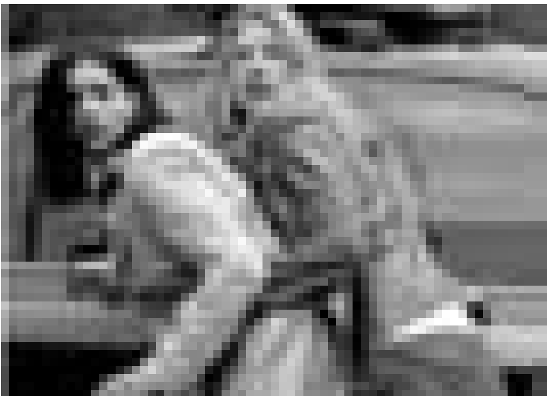
Encore plus effrayant que le premier ... "Final Destination 2" de David R. Ellis avec A.J. Cook et Ali Larter. A l'Utopolis.