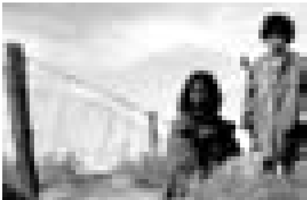
Aborigènes en 1931 ... "Rabbit Proof Fence" de Phillip Noyce, avant-première à l'Utopia, jeudi 19h30.