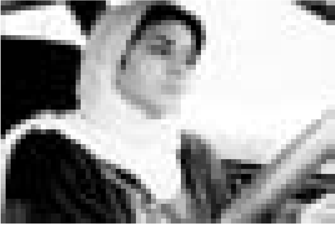
Femmes de l'Iran ... "Ten" d'Abbas Kiarostami, présenté par Cinédit, mercredi et jeudi à 19h à l'Utopia.