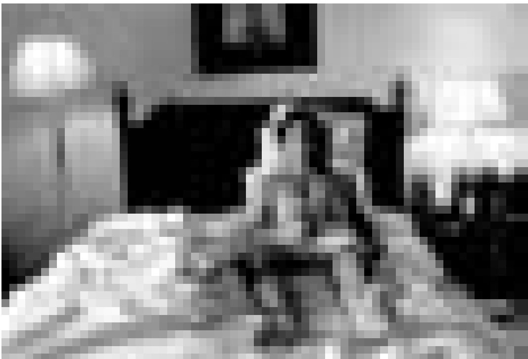
L'attraction de la bière ... Ian Somerhalder dans "The Rules of Attraction" de Roger Avary. Nouveau à l'Utopolis.