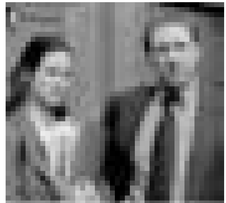
Militants contre la peine capitale ... Laura Linney et Kevin Spacey dans "The Life of David Gale" d'Alan Parker. Nouveau à l'Utopolis.

En avant-programme: "Final Flight of the Osiris", 11', prologue à "The Matrix Reloaded".