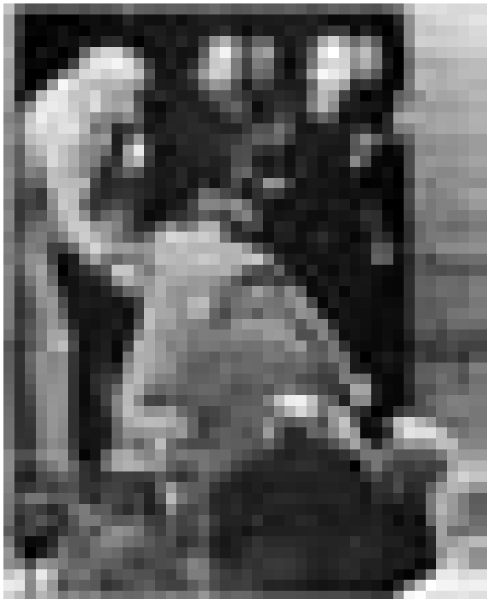
Un film produit par des travailleurs juifs de l'usine d'Oscar Schindler, survivants du Holocauste: "Schindler's List", mise en scène de Steven Spielberg. A la Cinémathèque, dimanche à 20h30.