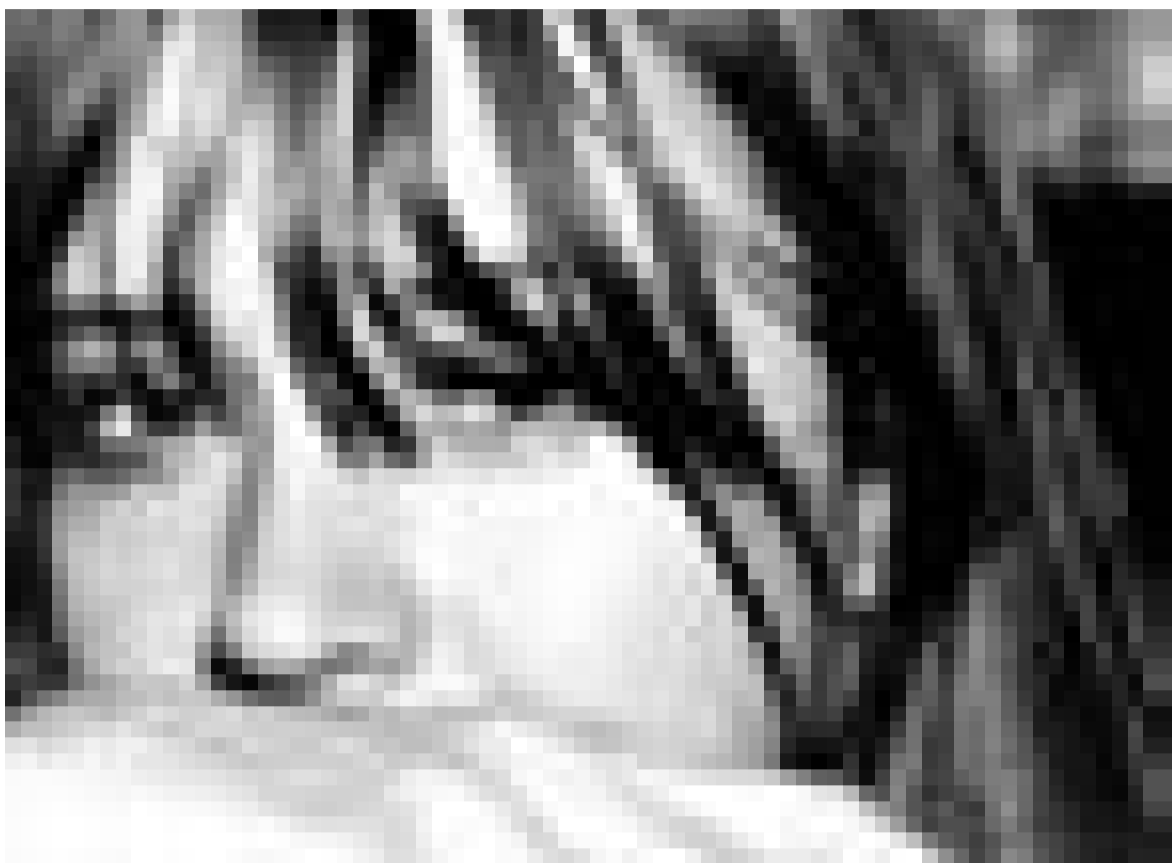
Catpower. Am Montag, den 9. Juni in der Kulturfabrik in Esch.