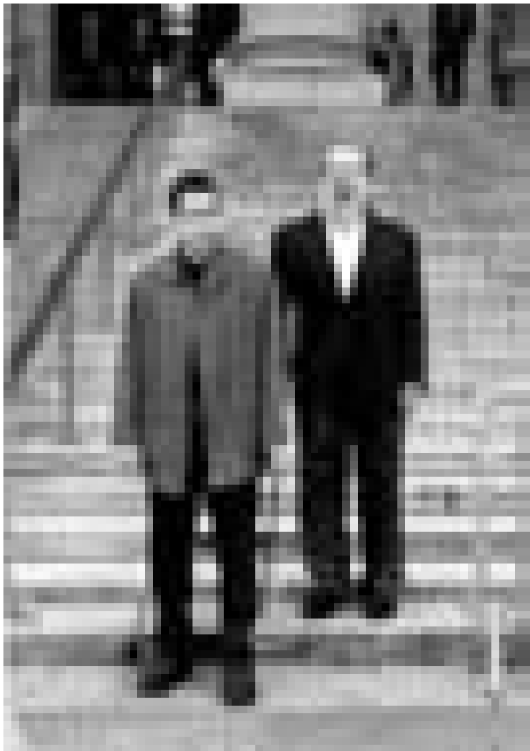
Un impatient et son psychiatre ... Adam Sandler et Jack Nicholson dans "Anger Management" de Peter Segal. Nouveau à l'Utopolis.