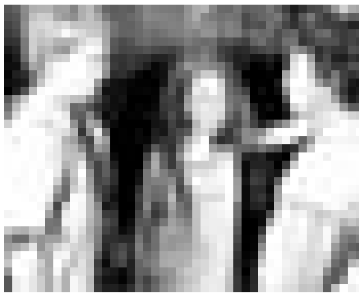
Sie haben Gender-Probleme ... "Hilfe, ich bin ein Junge" von Oliver Dommengel. Neu im Cinémaacher (Grevenmacher).

Neo apprend à mieux contrôler ses dons naturels, alors même que