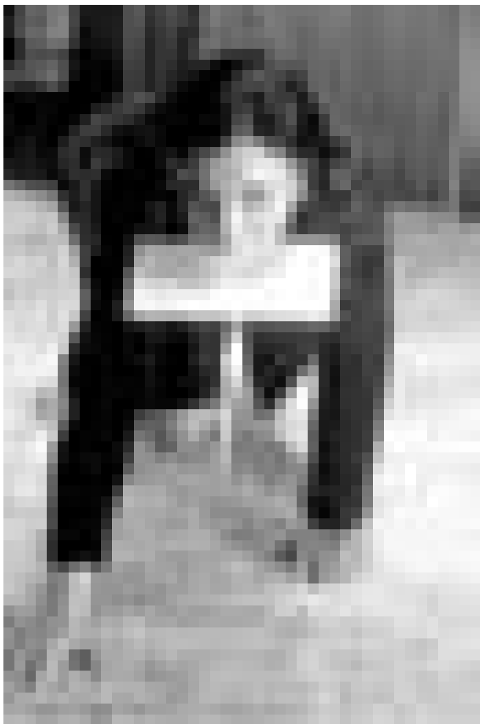
Elle vient de quitter l'hôpital psychiatrique ... Maggie Gyllenhaal dans "Secretary" de Steven Shainberg. Nouveau à l'Utopia.