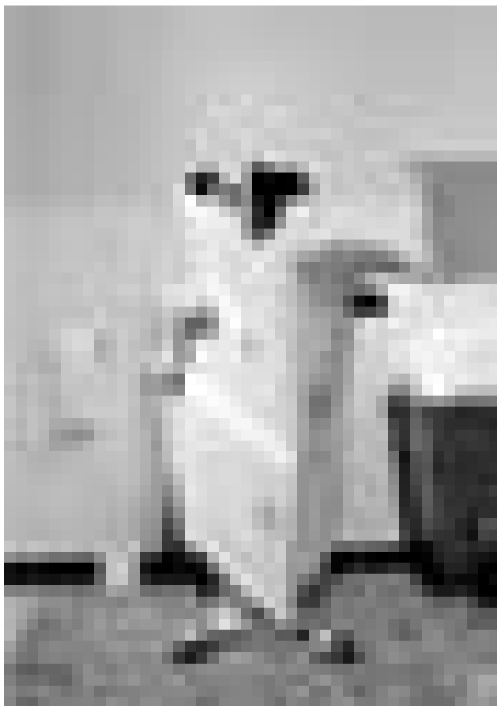
Le Bon Dieu l'a changé ... "Bruce Almighty" de Tom Shadyay. Avant-première à l'Utopolis.