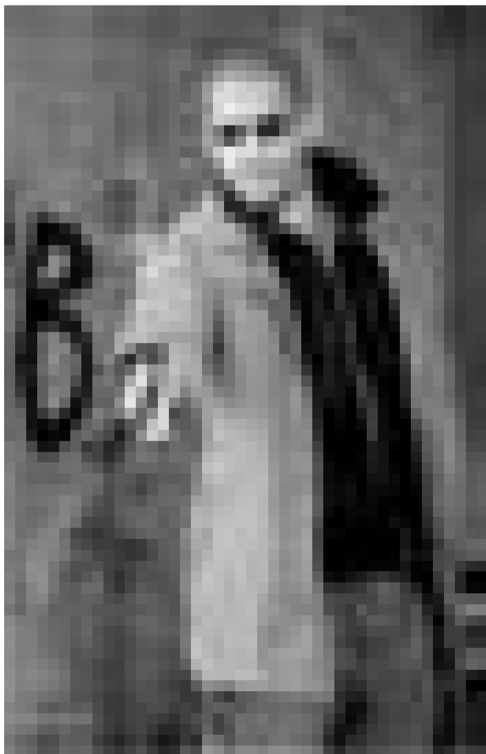
Il doit mettre fin aux agissements ... Vin Diesel dans "A man apart" de F. Gary Gray. Nouveau à l'Utopolis (Luxembourg) et à l'Ariston (Esch/Alzette).