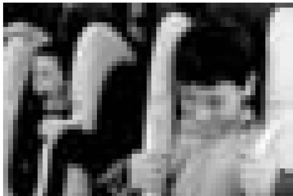
"El bola" d'Achero Mañas

Natalia Verbeke . 114'. V.o., s.-t. fr.; à partir de 14 ans.