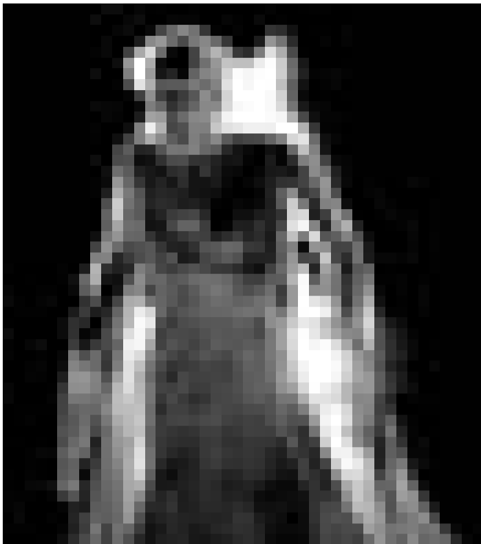
Elle se venge sur les enfants ... "Darkness falls" de Jonathan Liebesman. Nouveau à l'Utopolis.