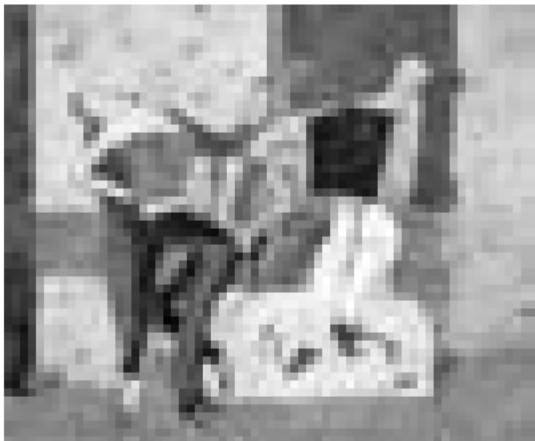
"Coups de coeur" à la Galerie Schortgen, Luxembourg-ville, jusqu'au 15 septembre 2003.

Galerie La Louve (rue Saint-Orban, tél. 0032 63 42 42 02), jusqu'au 10.9, sa. + di. 15h - 20h, en semaine sur rendez-vous.