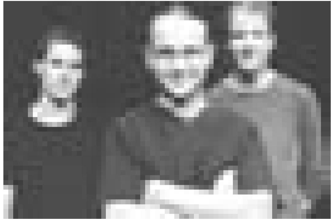
"Zoom" aus der Schweiz versteht sich als Jazzcombo, Kammermusikensemble und Rockband zugleich. Am 19. September im Café "Ubu" in Esch/Alzette.

Bauremaart a Wëlkaarfest, Cornelys Haff, Heinerscheid, 11h - 18h. Tél. 26 90 75-1.